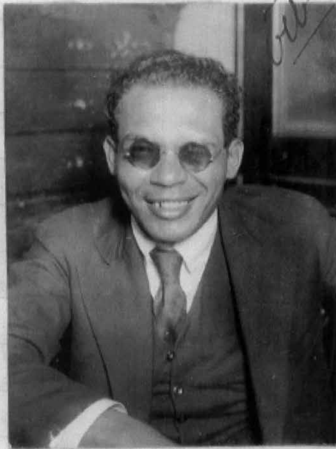
Photographia de Feltonio Indio do Brasil na 4ª Delegacia Auxiliar.