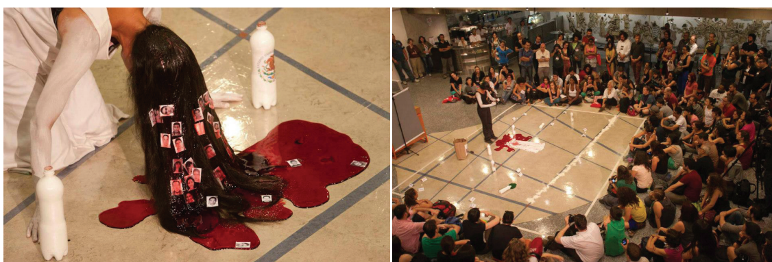
Imagens 10 e 11: Performance Réquiem para uma Terra Perdida , no SESC Vila Mariana. São Paulo, 17 de janeiro de 2013.

Luna defende que “através da performance, o corpo feminino se converte em um sujeito transgressor dos papéis que lhe são atribuídos. Em um lugar de diferenças, em que aceita o outro e assume e expressa sua posição e suas vivências dentro de um contexto social e histórico determinado, mas apontando para a possibilidade e realização de espaços imaginários multidimensionais” (LUNA, 2010, p. 7) 14 . E é neste espaço multidimensional e fronteiro entre teatro, performance e ativismo que Luna manipula seu corpo político como um lugar de resistência, identidade e luta.