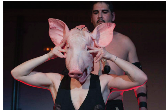
Imagens 1 e 2: La Pocha Nostra e performers de diferentes nacionalidades convidados para Corpo Insurrecto: Ações Psicomágicas para um mundo estragado. SESC Vila Mariana. São Paulo, 15 de janeiro de 2013.