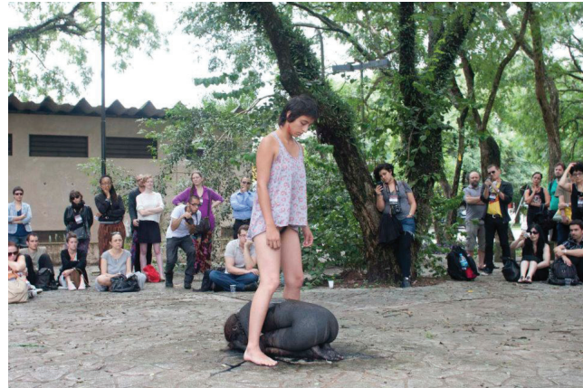
Imagens 8 e 9: Performance Piedra, de Regina José Galindo. São Paulo, 17 de janeiro de 2013.