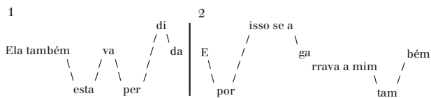
Figura 1: Desenho melódico de “Ainda É Cedo” – 13º e 14º versos.

É comum que as frases melódicas, em sua maioria, correspondam às unidades entoativas, mas nem sempre os autores mantêm essa regularidade. O início de duas estrofes dessa mesma canção, com frases melódicas idênticas, pode nos ajudar a compreender como se criam unidades entoativas diferentes a partir do mesmo perfil melódico. Na primeira vez, as duas frases melódicas, quando letradas (“Ela também estava perdida / E por isso se agarrava em mim também”), correspondem igualmente a duas unidades entoativas 6 :