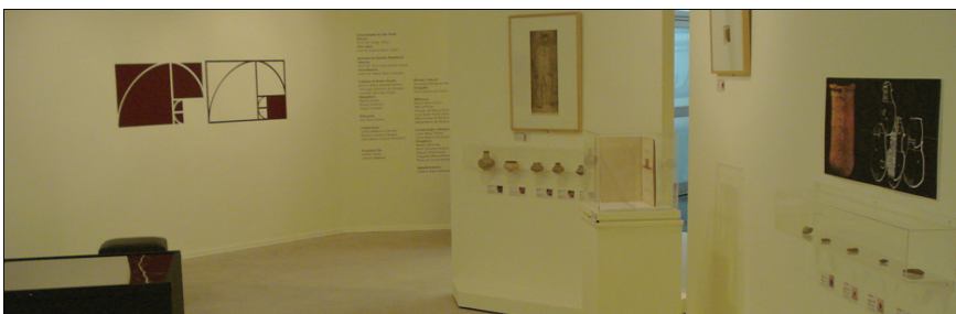
Figura 6: As licocós do Mário