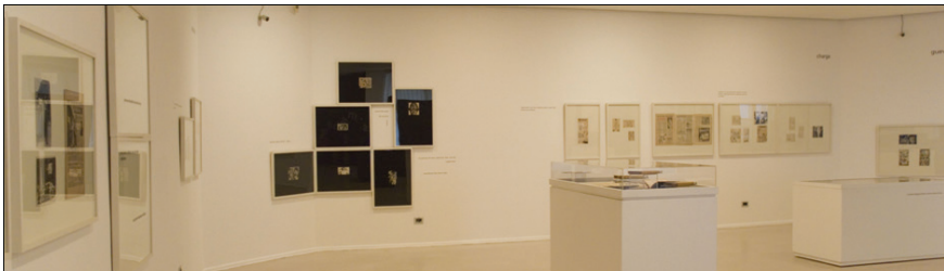
Figura 10: As manhas do Barão .