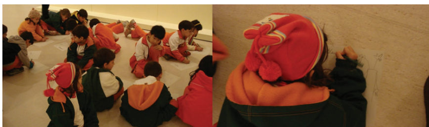
Figura 2: Oficina temática no espaço