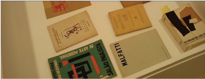
Figura 9: A Exposição na Exposição – O Averso do Averso .