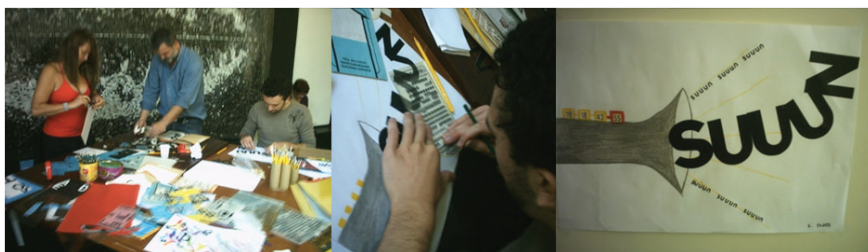
Figura 3: Oficina Blaise Cendrars – Escrevendo com Formas