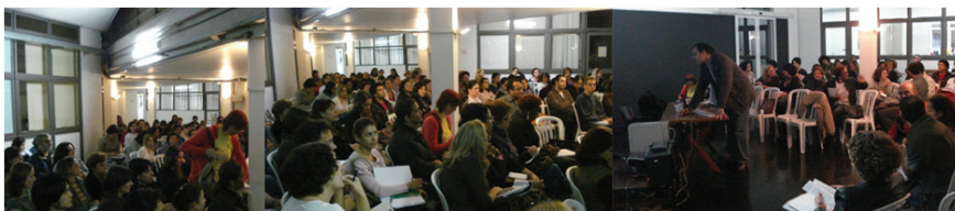
Imagem 4: Seminário Mário, educador: infância e arte