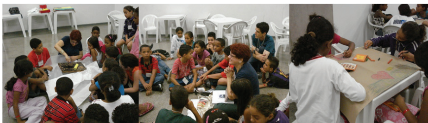
Figura 1: Oficina temática no espaço escolar