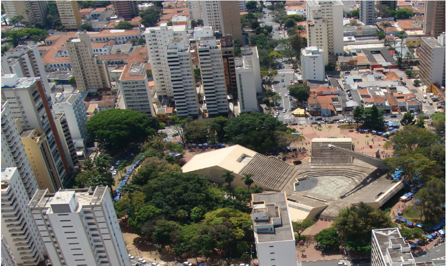
Figura 5: Vista aérea do Centro de Convivência de Campinas implantado sobre a Praça Imprensa Fluminense. Foto do autor, 2008.

teatro, espaços de exposições e galerias) sob as arquibancadas fragmentadas por espaços livres de tamanhos diversos. O inusitado projeto foi instalado sobre uma praça-jardim que, antes disso, no século XIX, foi um Passeio Público. Por sua complexidade morfológica e de usos, onde se imbricam os espaços edificados e livres, não se pode caracterizar isoladamente nem a Praça (bem de uso comum do povo) nem o Centro de Convivência (bem de uso especial por dentro, mas de uso comum do povo por fora); dessa forma, tem-se uma unidade complexa, um espaço híbrido 28 .