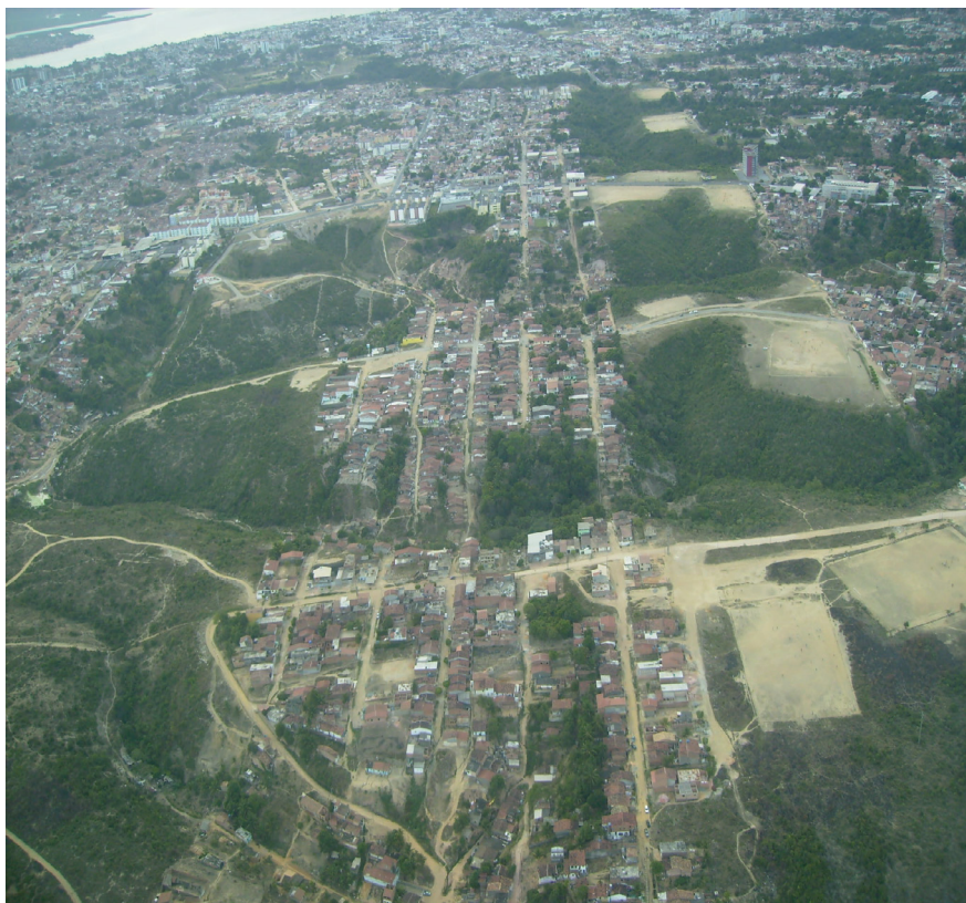
Figura 5: Campinhos de futebol na periferia de Maceió. Importantes espaços da esfera pública geral. Foto: Acervo QUAPÁ (FAU-USP), 2007.

Mais valioso que o exercício exaustivo de tipificação é o reconhecimento da natureza híbrida de inúmeros espaços públicos do sistema de convívio e lazer brasileiro. Entre os principais estão as praças-jardim, normalmente designadas oficialmente como praças, mas que, por seu excessivo ajardinamento, impedem que se realizem manifestações públicas de maior porte, sendo pouco apropriadas à esfera pública política. Por outro lado, se propôs distinguir as praças-jardim das praças ajardinadas 25 ; estas apresentam ajardinamento que não impede sua caracterização enquanto praças, possuindo superfícies pisoteáveis e