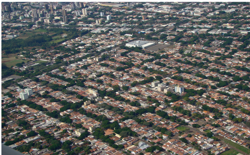
Figura 1: Maringá e sua reconhecida arborização viária.

com a mobilidade longitudinal das calçadas. Passeios de boas dimensões, arborizados, que permitam a circulação de pedestres, portadores ou não de necessidades especiais, deveriam ser regra básica para as municipalidades brasileiras, sobretudo na faixa intertropical. Infelizmente, tais condições são exceção em nosso quadro urbano.