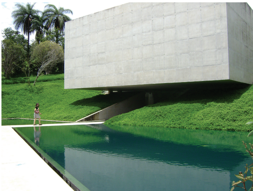
Figura 6: Pavilhão de Adriana Varejão em Inhotim. Foto do autor, 2009.

de Belo Horizonte. O local abriga uma riquíssima coleção particular de arte contemporânea – instalações e obras de grandes dimensões, bem como exposições temporárias e espaços para outras atividades culturais e educacionais. Os pavilhões se distribuem em meio a extensos jardins e fragmentos de mata, criando um dos únicos jardins botânicos privados do país aberto ao público, com a maior coleção de palmeiras, num projeto de altíssimo nível e de excelente manutenção. Inhotim é, portanto, espaço privado de alto interesse público.