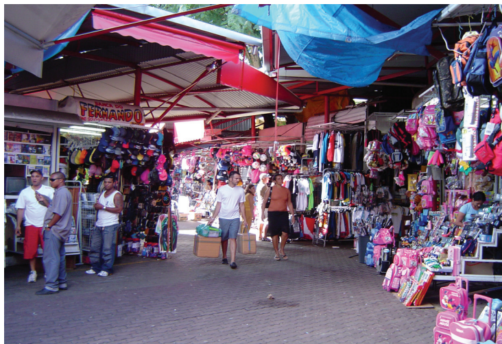
Figura 7: Praça Ópera Guarani, no centro de Campinas, a instalação de um terminal de ônibus estimulou a fixação de ambulantes em um camelódromo. Espaço de intensa e diversificada apropriação pública. Foto do autor, 2005.

Várias praças, sobretudo em áreas não centrais, só apresentam movimento em decorrência da existência de algum estabelecimento comercial. É ele que motiva o convívio público. Feiras podem caracterizar a dinâmica de ruas, praças, bairros e até mesmo de algumas cidades brasileiras, se configuram não só como espaços de trabalho, renda, lucro e consumo (domínio das necessidades), mas também de encontros, convívio, cultura e vida pública (domínio da liberdade).