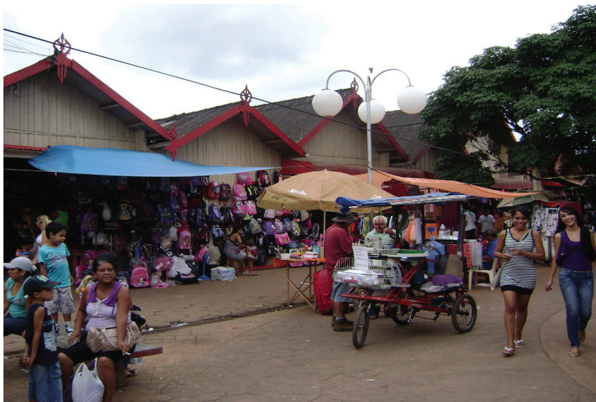
Figura 2: Apropriações do calçadão pelo comércio popular em Rio Branco, lugar de compras e de convívio.

Praças, parques, jardins e similares formam a estrutura oficial do sistema de espaços livres públicos de convívio e lazer das cidades brasileiras, ou simplesmente denominado “sistema de lazer” por inúmeras municipalidades.