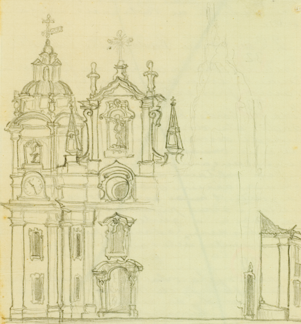
Sé Belém Para