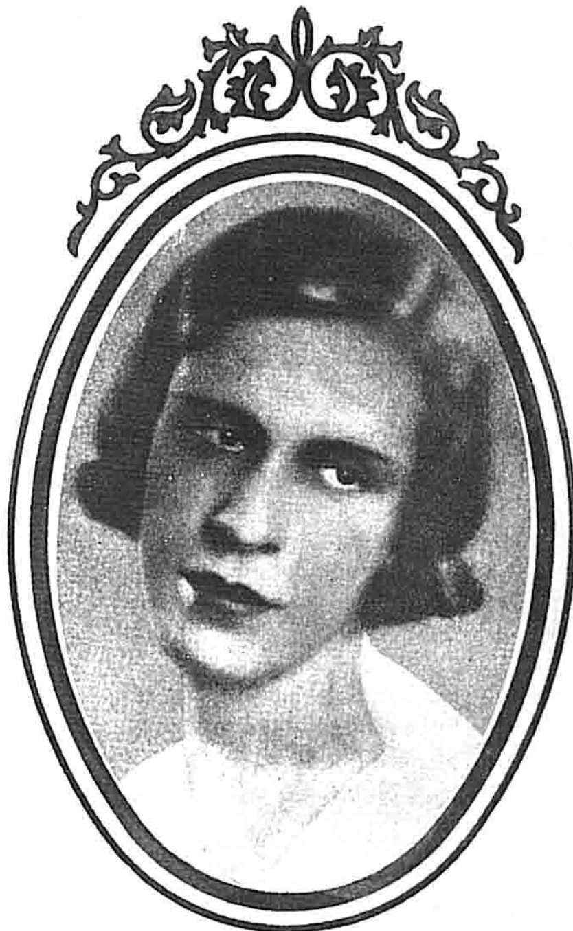
DINORÁ DE CARVALHO