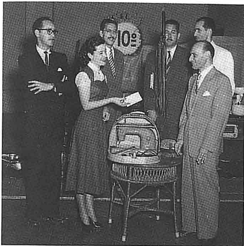
Acervo Projeto Memória-SENAI-SP

O acervo de imagens do SENAI-SP, único e singular, ajuda a compreender a história do trabalho na indústria.