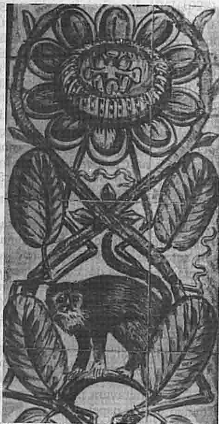
Detalhes. Azulejos na Igreja N.S. do Brasil.

A ornamentação é tão variada e rica que estamos preparando um estudo mais detalhado para melhor apreciar tantos anos de trabalho. O artista estudou profundamente cada tema que representou, como pode ser verificado na Capela das Nossas Senhoras da América Latina. Encontram-se representadas a Nossa Senhora Aparecida, Padroeira do Brasil, a Virgem de Caacupe, do Paraguai, Nossa Senhora de Lujan, da Argentina, e Nossa Senhora de Gua-