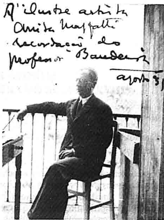
Manuel Bandeira, 1931.

A COMISSÃO ABAIXO ASSIGNADA TEM A HONRA DE CONVIDA-LO E À EXMA. FAMÍLIA PARA ASSISTIREM À INAUGURAÇÃO DA XXXVIII EXPOSIÇÃO GERAL DE BELLAS-ARTES, A REALIZAR-SE NO DIA 1.º DE SETEMBRO ÀS 15 HORAS, NO EDIFÍCIO DA ESCOLA NACIONAL DE BELLAS-ARTES