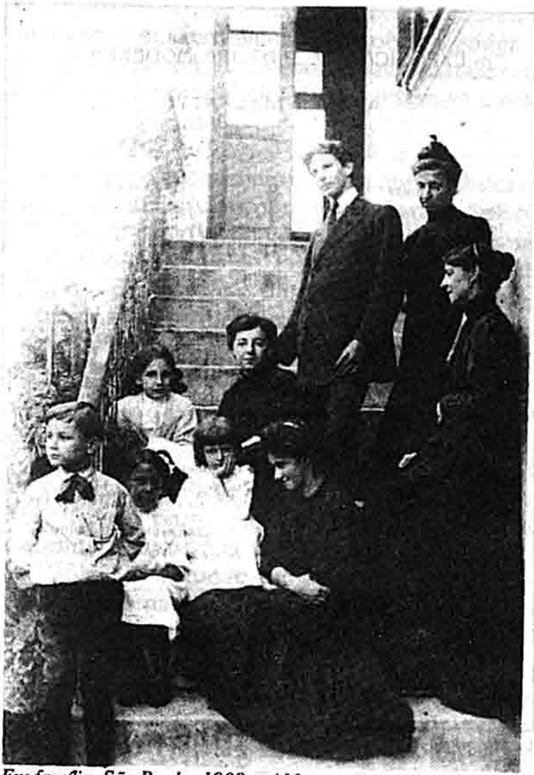
Em família, São Paulo, 1908 c. AM ao centro da foto.