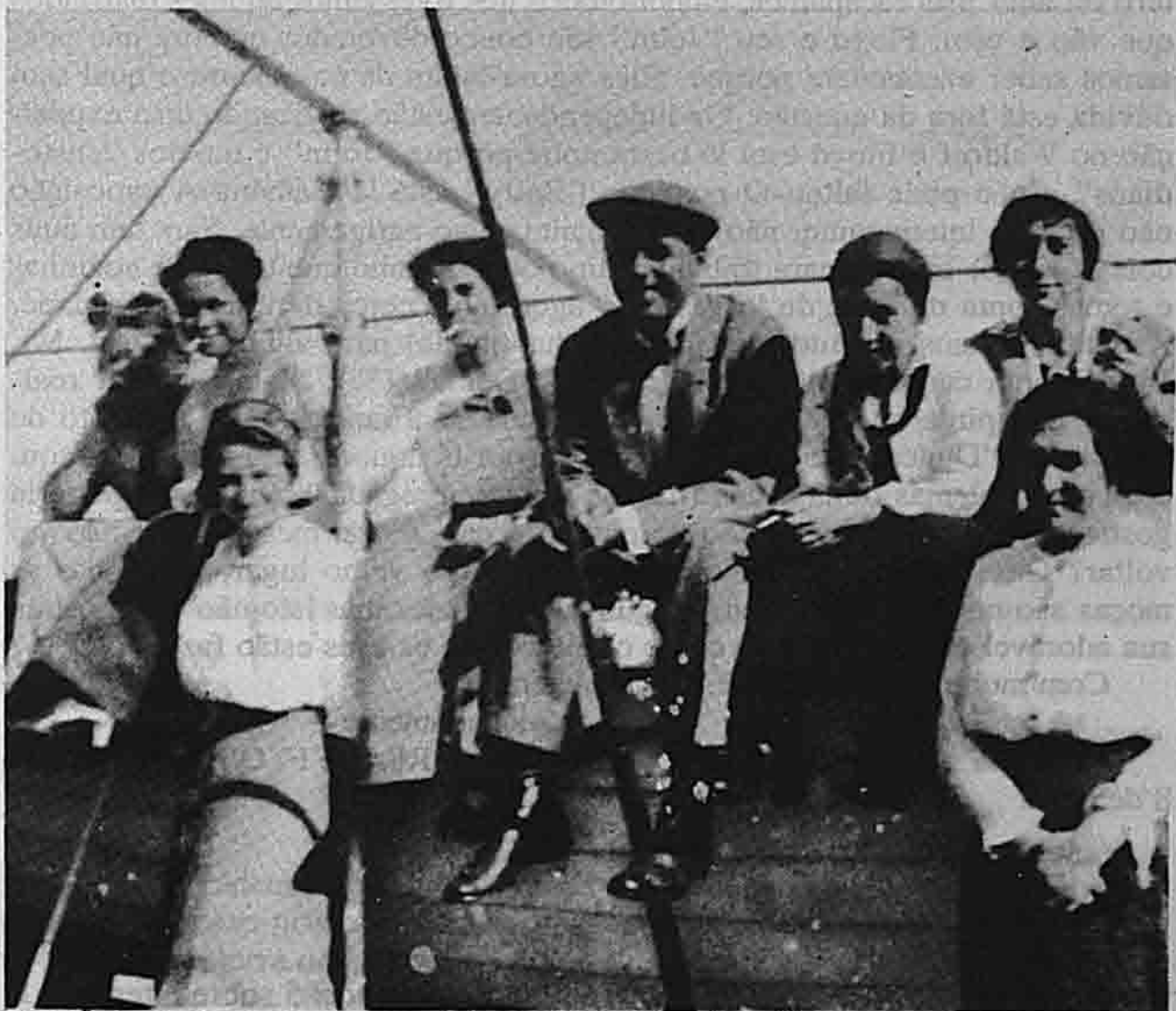
Nos Estados Unidos: AM e colegas no barco (voltando de Monhegan?)

(N. — junto com a carta, um recorte de jornal alemão, com crítica a uma exposição em que figuravam obras de H. von den Hoff.)