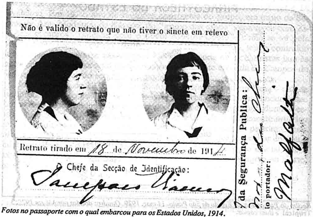
Fotos no passaporte com o qual embarcou para os Estados Unidos, 1914.