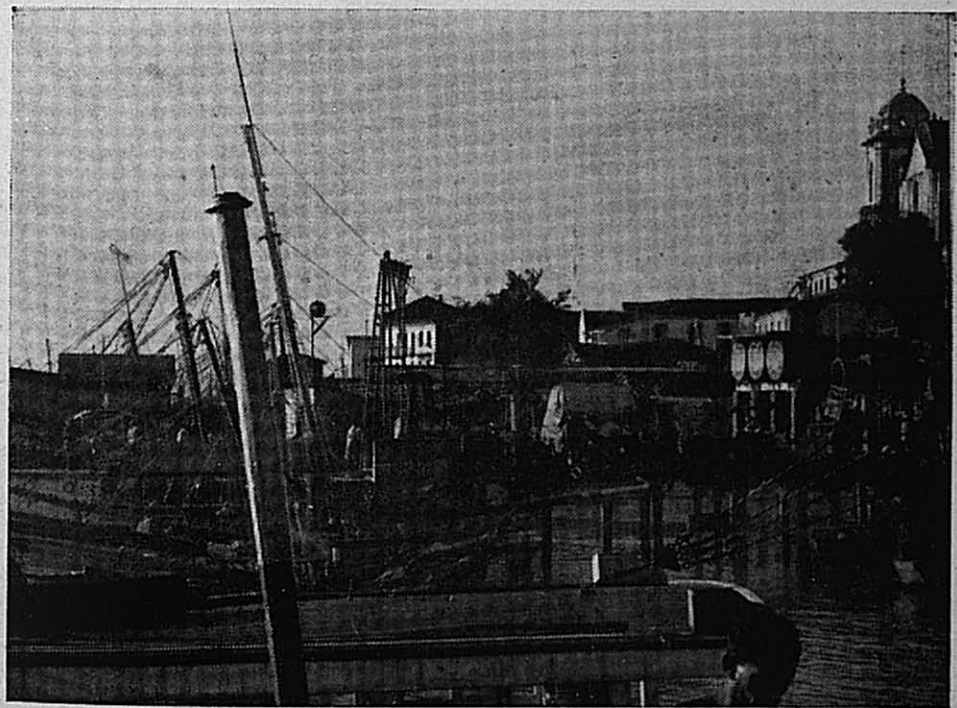
Fotos 1 e 2 — O sítio do núcleo original da cidade — Na foto superior vê-se a entrada da doca do Ver-O-Pêso e o terraço sôbre o qual foi construído o Forte do Presépio; na foto inferior, observa-se, claramente, o acentuado e brusco desnível que existe entre a parte ocidental do velho núcleo (antiga igreja dos Jesuítas) e as águas da baía de Guajará.