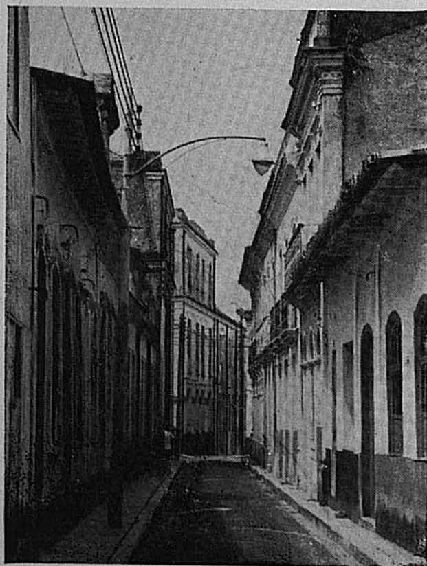
Fotos 7 e 8 — A rua dos Cavaleiros e a travessa da Residência — Na rua Dr. Malcher, algumas fachadas reformadas não conseguem esconder a antiguidade de sua abertura; o traçado irregular denuncia a espontaneidade de sua abertura. As torres da Catedral (à esquerda) e da igreja dos Jesuítas (S. Bartolomeu, à direita), marcam o local de onde se expandiu a Cidade Velha, rumo sul. Na foto inferior, a Travessa da Residência (entre as ruas do Norte e do Espírito Santo); estreita, toda construída, ladeada por casas térreas com amplos beirais e por sobradões com as clássicas sacadas guarnecidas com grades de ferro, é bem o testemunho de uma época da vida de Belém.