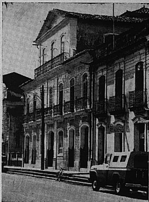
Fotos 9 e 10 — A Igreja dos Jesuítas e o solar do Barão de Guajará — A Igreja de Santo Alexandre resulta de uma última reforma efetuada em prédio mais antigo que sucedeu às duas primitivas construções dos Jesuítas (1653 e 1658). É uma obra de estilo barroco peculiar, colocada em frente à catedral, no largo da Sé. Já o solar do Barão de Guajará é construção da primeira metade do Séc. XIX; situado no largo do Palácio, possui a aparência de muitos sobrados de São Luiz do Maranhão graças ao sótão: revestido extremamente de azulejos, ornamentado pelos grãos de ferro de suas sacadas, possuindo mesmo um pátio interno, é o edifício que mais se destaca como marco do período que antecede o "ciclo da Borracha".