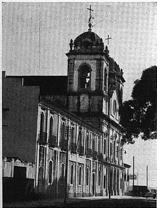
Fotos 3 e 4 — A rua do Norte e o largo do Carmo — As duas fotografias nos mostram um dos trechos mais antigos da cidade de Belém. Na foto superior a atual rua Siqueira Mendes, junto ao largo do Carmo; o casario guarda um aspecto característico da arquitetura portuguesa, com suas sacadas guarnecidas com gradis de ferro e inúmeras portas para a rua. Depósitos ou armazéns no andar térreo; moradas na parte superior. Já o edifício atual da igreja do Carmo, no largo do mesmo nome, data de 1766; daí o estilo neo-clássico de sua fachada, obra do arquiteto Antonio Landi.