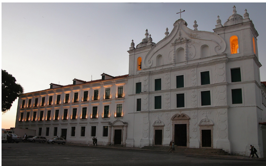
Figura 07: Fachada da Igreja de São Francisco Xavier e Colégio de Santo Alexandre. Fonte: Ricardo Hernán Medrano, julho de 2007.