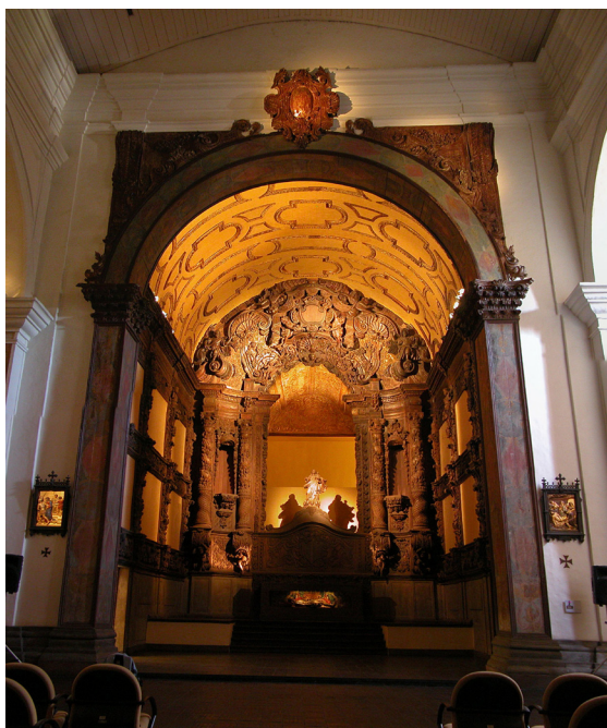
Figura 02: Capela-mor da Igreja de São Francisco Xavier.