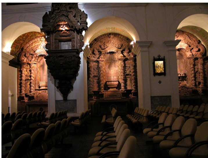
Figura 05: Capelas laterais do lado da epístola. Observar retábulos ainda conservados. Fonte: Ricardo Hernán Medrano, agosto de 2007.