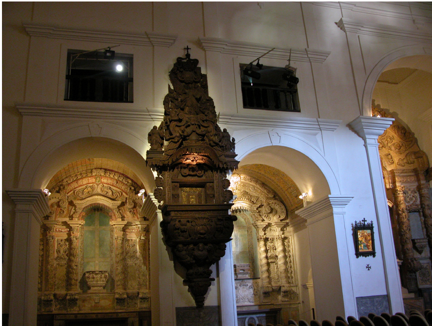
Figura 08: Púlpito da Igreja de São Francisco Xavier. Lado do evangelho. Fonte: Renata Maria Martins, agosto de 2007.