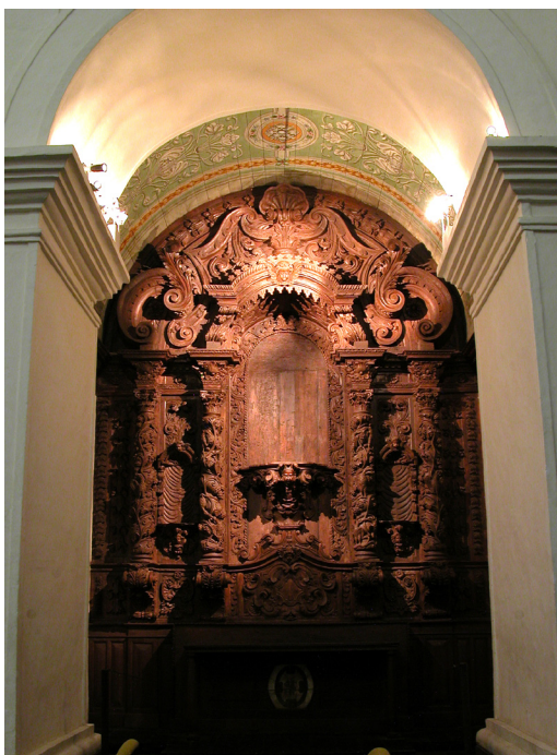
Figura 04: Altar com monograma “SM”.