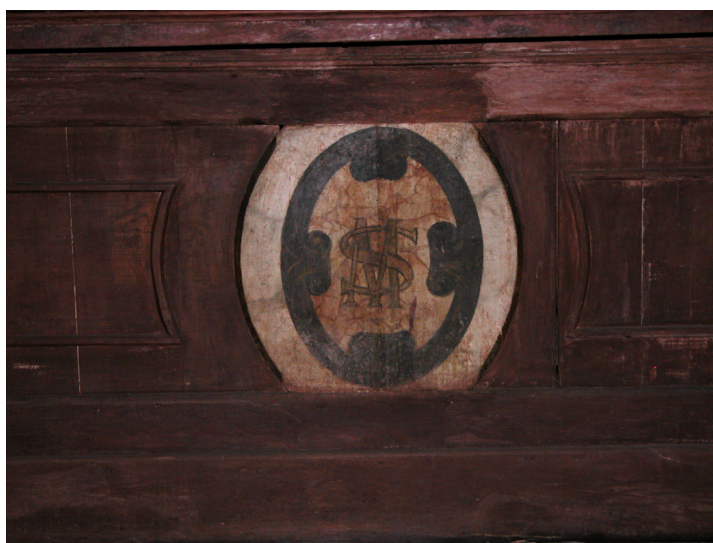
Figura 03: Monograma “SM” na mesa do altar da primeira capela lateral, lado da epístola, podendo indicar que o altar seria sagrado a “São Miguel”. Fonte: Ricardo Hernán Medrano, agosto de 2007.