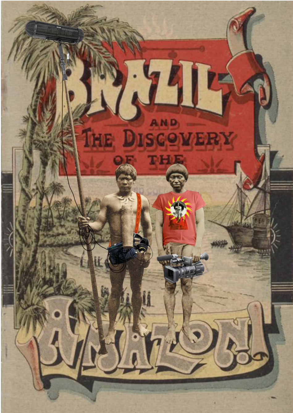
Figura 7 - BANIWA, Denilson. Ficções Coloniais. Colagem digital, 2021.