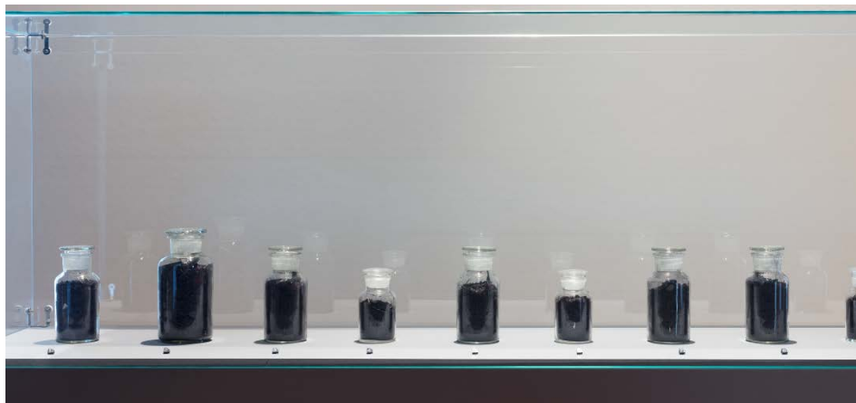
Figura 8 - BANIWA, Denilson. AMAKA, Terra Preta de Índio. Site Specific. 2020.