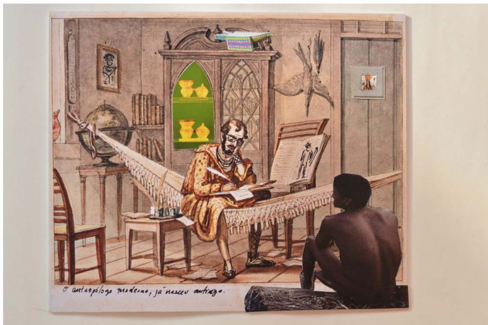
Figura 4 - BANIWA, Denilson. O antropólogo moderno já nasceu antigo. Colagem sobre fotografia, 2019.