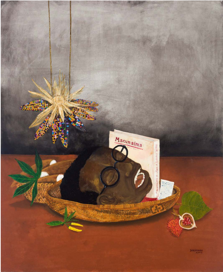
Figura 3 - BANIWA, Denilson. Re-Antropofagia, 2018 - acrílica, argila, óleo sobre tela.