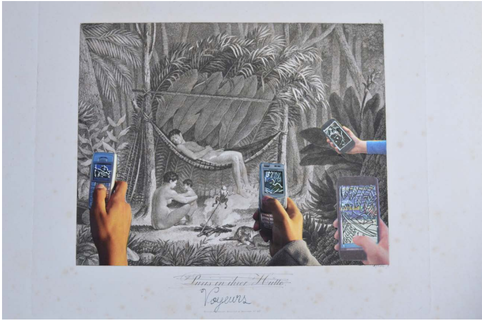
Figura 5 - BANIWA, Denilson. Voyeurs. Colagem sobre fotografia, 2019.