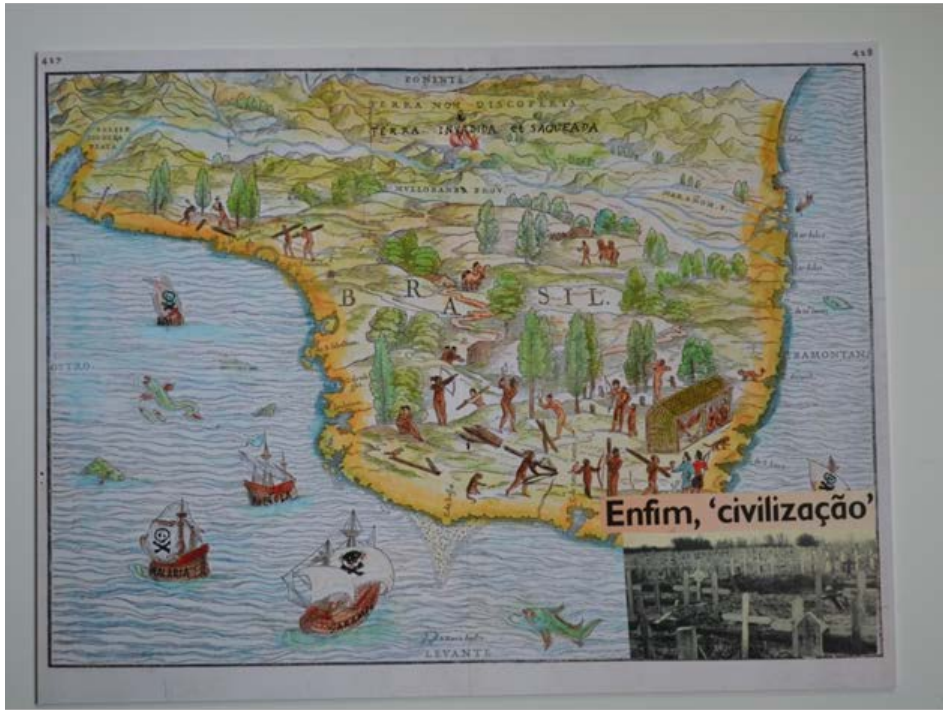
Figura 9 - BANIWA, Denilson. Enfim, Civilização. Colagem sobre fotografia, 2019.