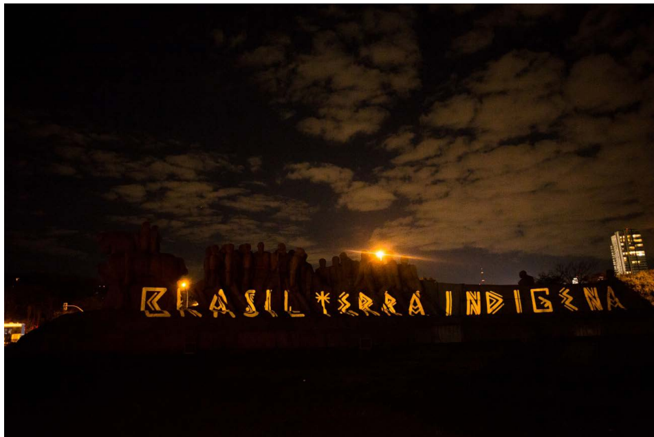
Figura 2 - Brasil Terra Indígena (2020), Denilson Baniwa. Projeção a laser sobre Monumento às Bandeiras (SP) em colaboração com Coletivo Coletores.