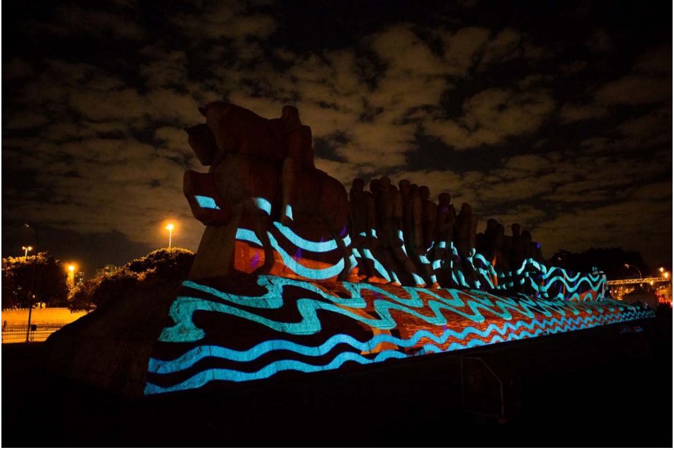
Figura 1 - Brasil Terra Indígena (2020), Denilson Baniwa. Projeção a laser sobre Monumento às Bandeiras (SP) em colaboração com Coletivo Coletores.