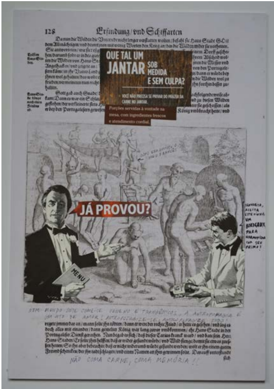
Figura 10 - BANIWA, Denilson. Menu. Colagem sobre fotografia, 2019.