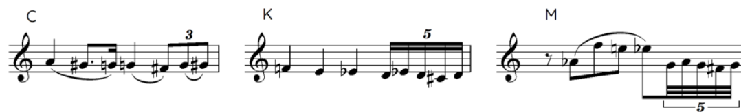
Figura 6: Relação sentencial entre temas (variação em desenvolvimento).

Na tabela acima, a indicação das regiões harmônicas segue a nomenclatura proposta por Schoenberg em funções estruturais da harmonia (Schoenberg, 2011) e se refere às regiões em modo menor. Uma segunda etapa da peça tem início no compasso 50 com a introdução de mais um tema (Tema I). Ao contrário do que havia acontecido anteriormente, este tema está em uma região distante da tônica, Sib menor, submediante menor da tônica menor na nomenclatura de Schoenberg. Até o compasso 99, quando se encerra esta parte da peça, o compositor passa por outras regiões distantes da tônica – com a breve exceção de um momento na subdominante menor nos compassos 77-78 – e apresenta mais seis novos temas. É marcante a relação entre os temas C, que havia aparecido na seção anterior (c. 18), e os temas K e M, que parecem ser variações do primeiro em ordem progressiva de distanciamento temático 8 :