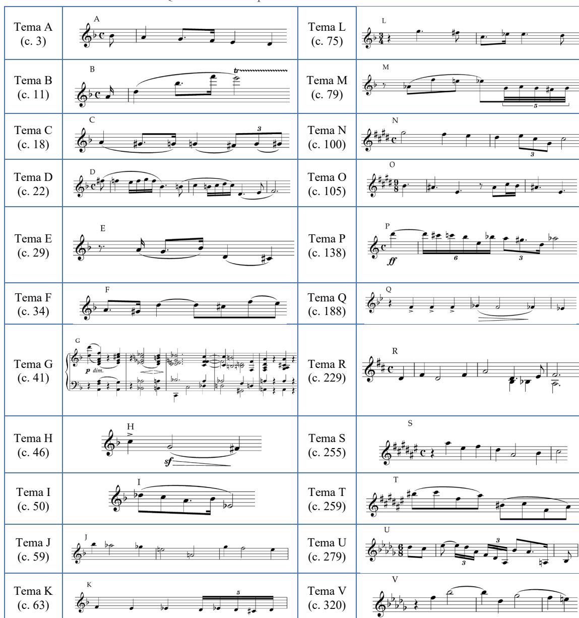
Quadro 1 - Principais temas de Verkürzte Nacht

A conexão entre os diferentes temas não parece ser suficiente, entretanto, para mitigar a dificuldade de observação da macroestrutura da Noite Transfigurada , já que estes temas são muitas vezes apresentados em simultaneidade uns com os outros ou são completamente transformados em seu conteúdo intervalar, rítmico e/ou textural para darem origem a novas ideias e seções formais. Na Noite Transfigurada existem 22 temas principais, que podem ser vistos na tabela abaixo (incluindo o compasso que marca sua primeira aparição na peça):