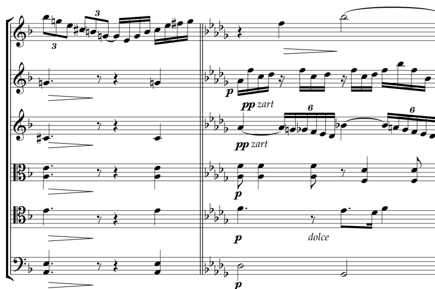
Figura 7: modulação surpreendente para Réb maior (compassos 319-320).

Como se pode observar pela figura abaixo, a escuta da dominante de Ré (Lá Maior) – em uma das raras vezes em que é colocada com clareza pelo compositor – dá a entender que se seguirá uma reexposição da tonalidade principal (Ré), entretanto, o retorno da tônica é retardado pela ocorrência de um trecho na tonalidade de Réb que antecede (e valoriza) o retorno triunfal da tônica 16 compassos depois (e que agora permanece incólume até o final). Segundo Shawn (2003, p. 20) “estas modulações ocorrem através de ‘armadilhas musicais’ perfeitamente naturais, embora nunca antes ouvidas”: