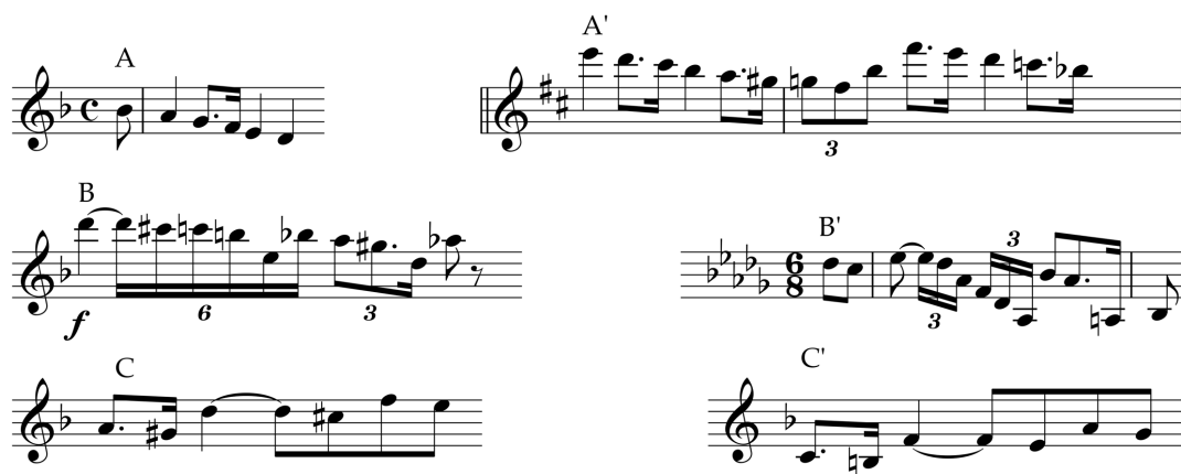
Figura 4: Comparação entre temas da Verklärte Nacht . À esquerda os temas da primeira parte e à direita os da segunda

Durante o Romantismo, a utilização de acordes provenientes do campo harmônico maior em peças em tom menor e vice-versa tornou-se um dado corrente da linguagem musical 7 . Na Noite Transfigurada , no entanto, a caracterização destes modos costuma se estabelecer com relativa clareza, de modo a ilustrar o conteúdo semântico do poema. Musicalmente, a transfiguração do pessimismo da mulher no otimismo do amante ocorre com a transformação dos temas em tonalidades menores e altamente cromáticos, que predominam na primeira parte da peça, em temas análogos em tonalidades maiores (mais diatônicos), que predominam na segunda. São inúmeros os casos de emprego deste procedimento, como mostram os excertos abaixo: