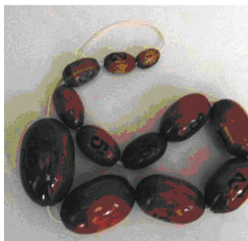
FIGURA 2: A medida testicular deve ser realizada com o orquidômetro, sendo o de Prader observado nessa foto.

A sequência do desenvolvimento das características sexuais secundárias no adolescente foi sistematizada por Tanner, em 1962 (Tabela 1) 5,11 . Esse autor descreveu estágios de maturação sexual que são classificados à inspeção durante o exame físico, e variam do Estágio 1 (infantil) ao 5 (adulto), considerando-se o desenvolvimento mamário (M) e a pilosidade pubiana (P) para o sexo feminino, e o desenvolvimento da genitália externa (G) e da pilosidade pubiana (P) para o sexo masculino. A aplicação das pranchas (modelos gráficos) e