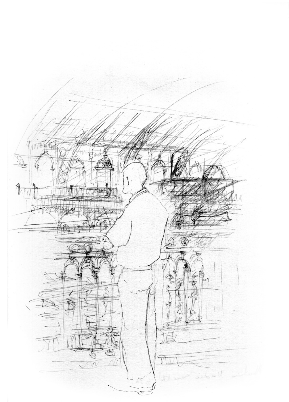
Figura 1. Estação da Luz.

Keywords: Estação da Luz panel. Design. Creative process. Art. Walk.