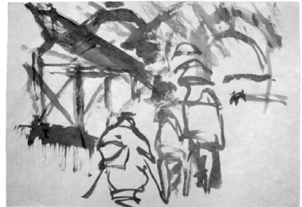
Figura 10. Desenho de pessoas