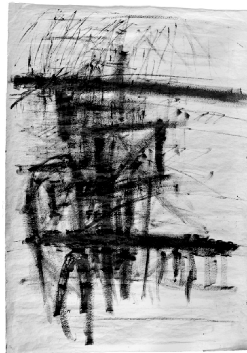
Figura 4. Desenho-chave para concepção do painel Estação da Luz