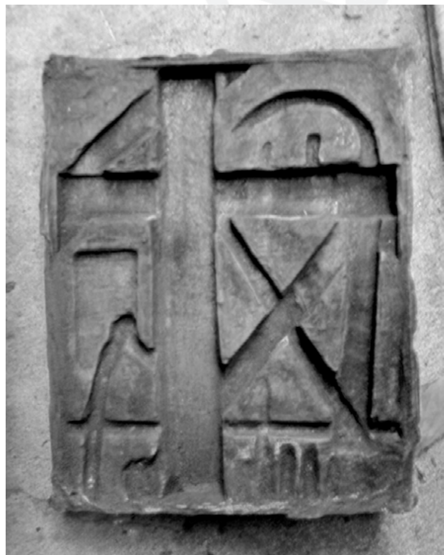
Figura 13. Estudo em fundição realizado no IPT- Instituto de pesquisa tecnológica