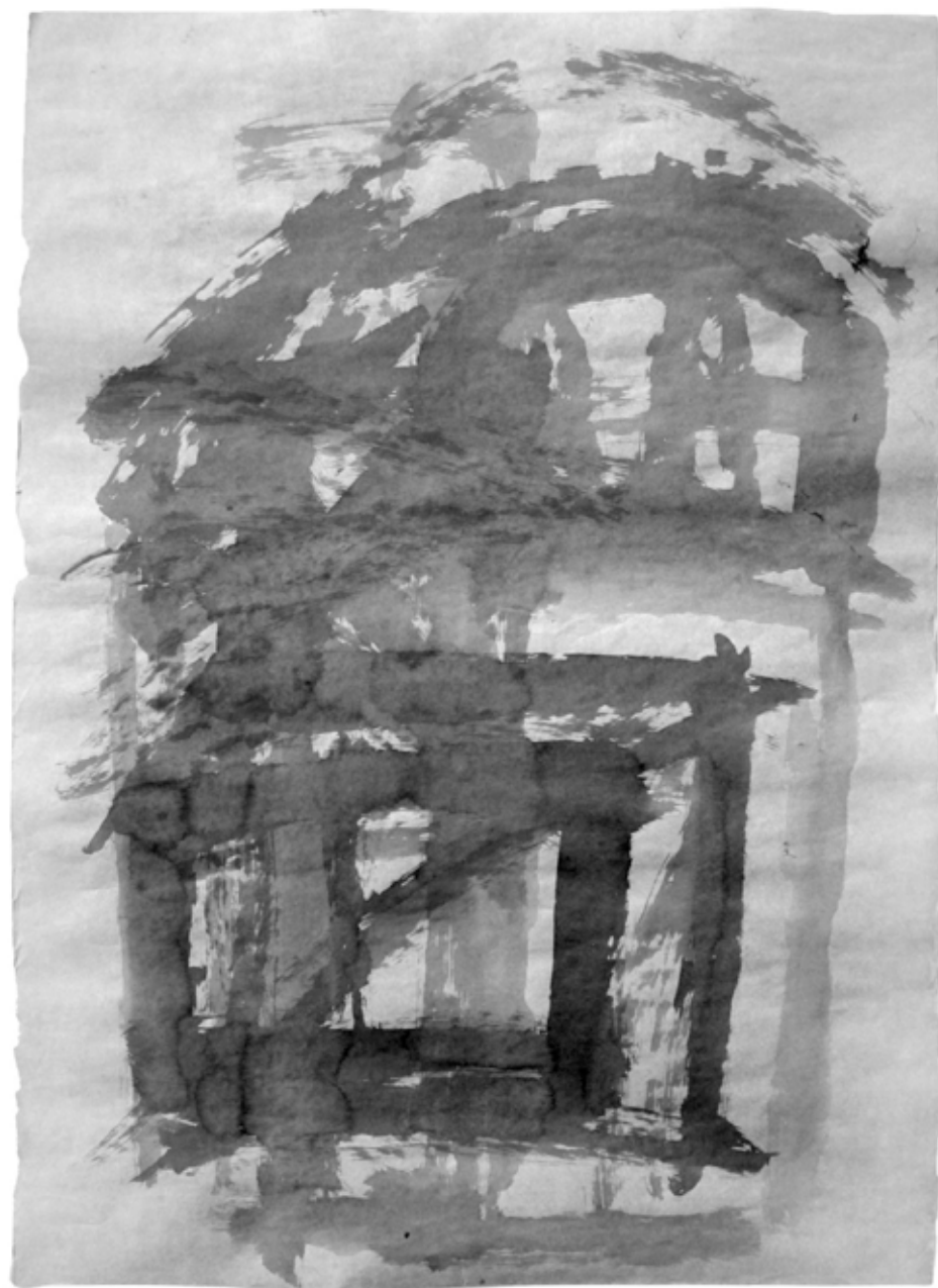
Figura 11. Estudo à nanquin para o painel Estação da Luz