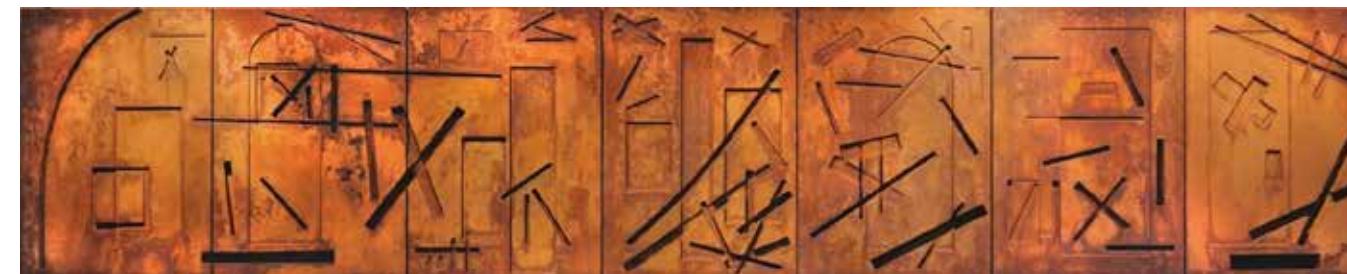
Figura 17. Painel Estação da Luz lado direito