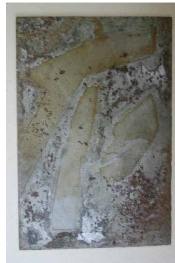
Figura 2. Gravura em metal