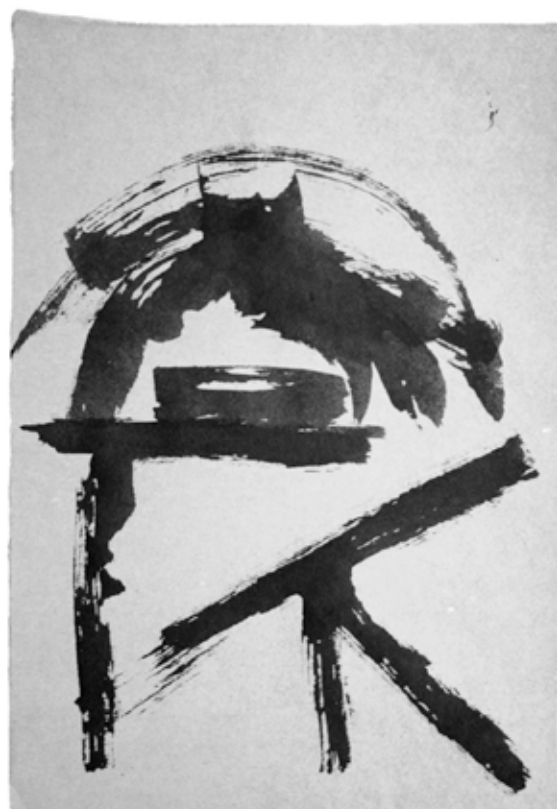
Figura 7. Sinais gráficos