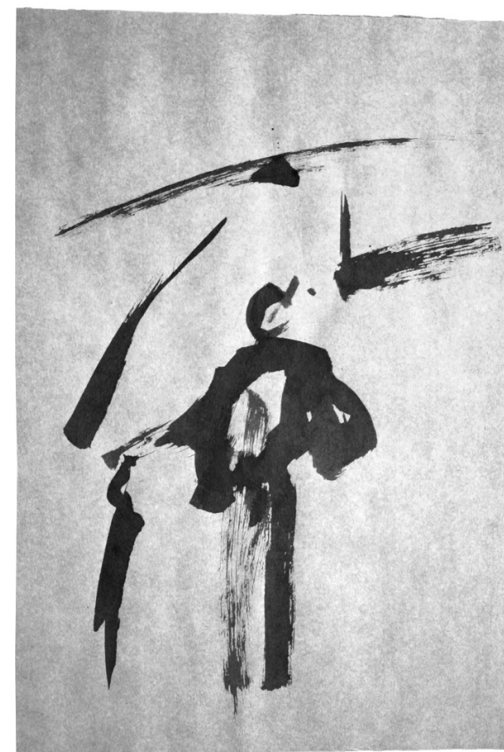
Figura 8. Sinais gráficos