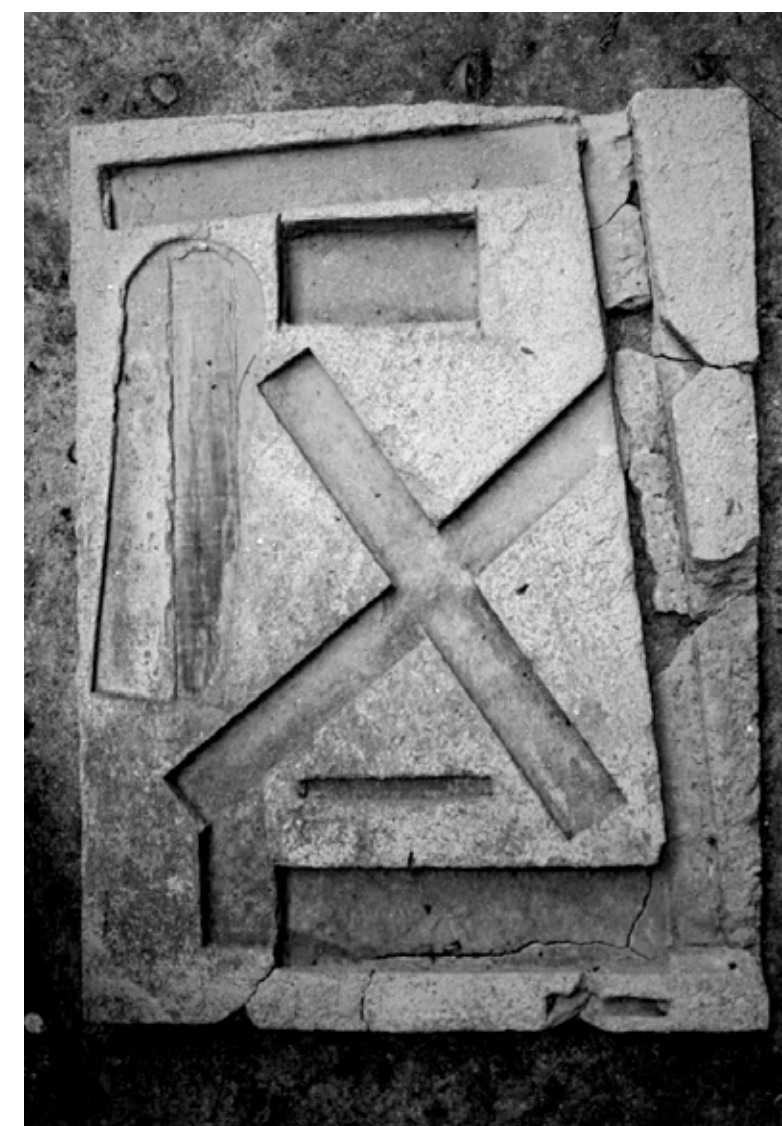
Figura 12. Formas básicas realizadas em argamassa