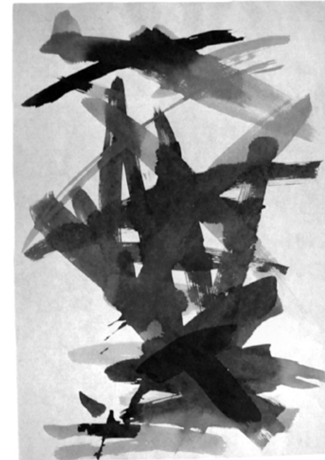
Figura 6. Sinais realizados na oficina