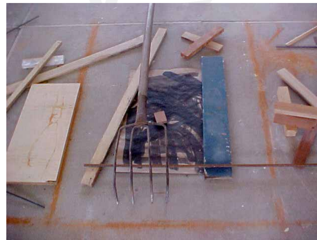
Figura 14. Estudo para o painel Estação da Luz realizado no Canteiro experimental FAU-USP