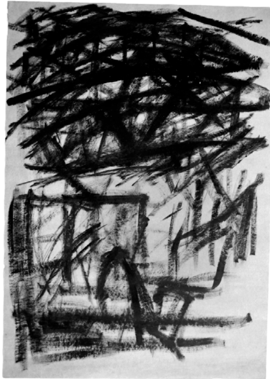
Figura 5. Desenho-chave para concepção do painel Estação da Luz