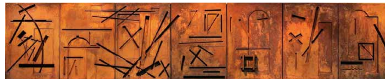
Figura 16. Painel Estação da Luz lado esquerdo