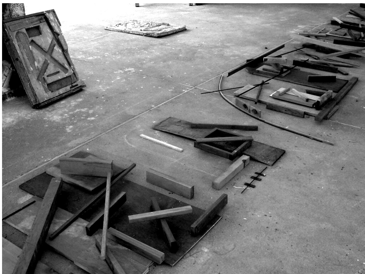
Figura 15. Desenho para o painel Estação da Luz realizado com retalhos de madeira no Canteiro experimental FAU-USP