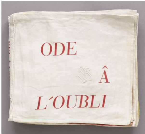
Fig. 1: Ode à l'Oubli . 28 x 31 x 4,5 cm. Livro de Tecido, ilustrado com trinta e cinco composições. 2002.