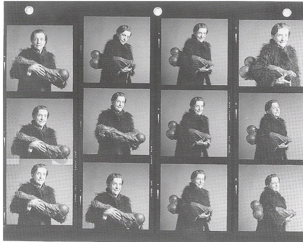
Fig. 3: Robert Mapplethorpe. Louise Bourgeois . 1982.

a qual pertence também Janus Fleuri . A suspensão, em ambas as obras, acentua a ambiguidade do referente, levando o observador a se mover incessantemente entre múltiplas possibilidades de significação, operando no registro do figural. Em Fillette , a forma fálica se metamorfoseia em silhueta feminina, bem como em órgão reprodutor feminino (vagina, trompas, útero) na medida em que o espectador em torno dela circula.