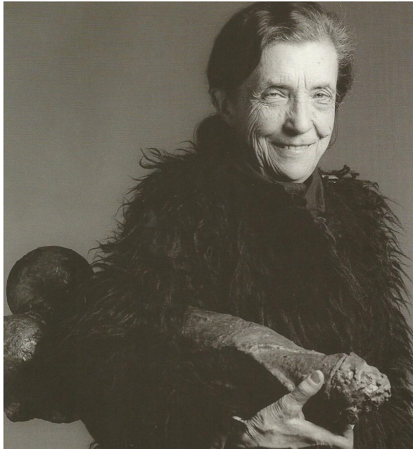
Fig. 4: Robert Mapplethorpe. Louise Bourgeois . 1982.

(...) a imobilidade da foto é como o resultado de uma confusão perversa entre dois conceitos: o Real e o Vivo: ao atestar que o objeto foi real, ela induz sub-repticiamente a acreditar que ele está vivo, por causa desse logro que nos faz atribuir ao Real um valor absolutamente superior, como que eterno; mas ao deportar esse real para o passado (“isso foi”), ela sugere que ele já está morto. Assim, vale dizer que o traço inimitável da Fotografia (seu noema) é que alguém viu o referente (mesmo que se trate de objetos) em carne e osso, ou ainda, em pessoa. 11