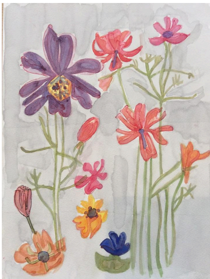
Estudo das formas e sobreposições a partir das aquarelas de Mackintosh. Técnica: Aquarela sobre papel canson, 2015.