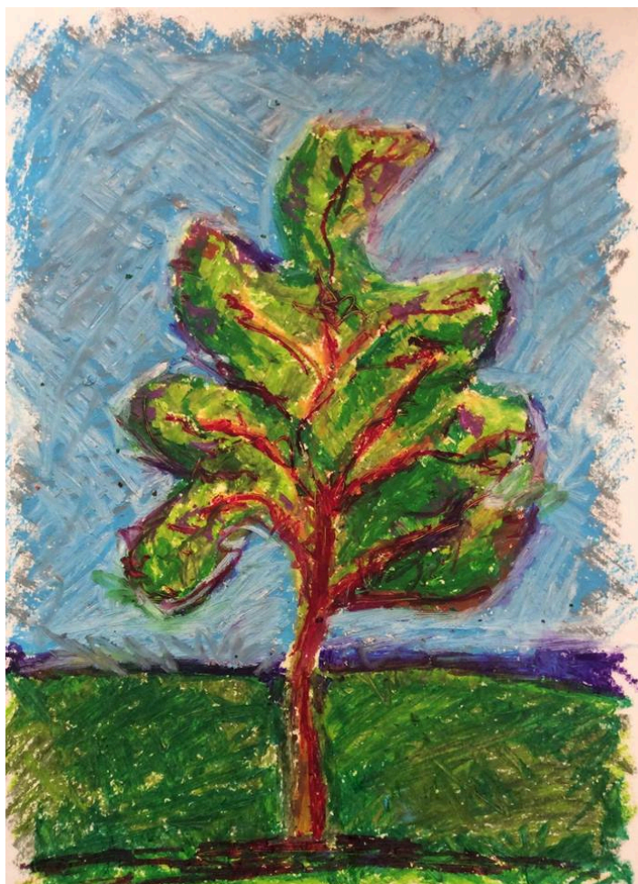
Observar e desenhar a paisagem depois de Van Gogh. Técnica: Pastel oleoso sobre papel canson, 2015.