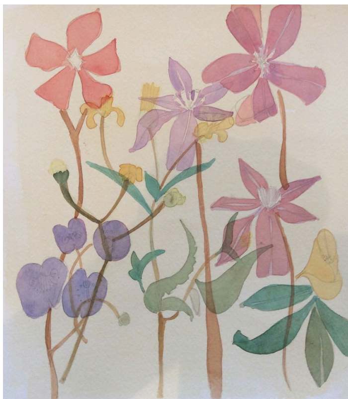
Estudo das formas e sobreposições a partir de desenhos da paisagem local e das aquarelas de Mackintosh.

Técnica: Aquarela sobre papel Fabriano, 2016.