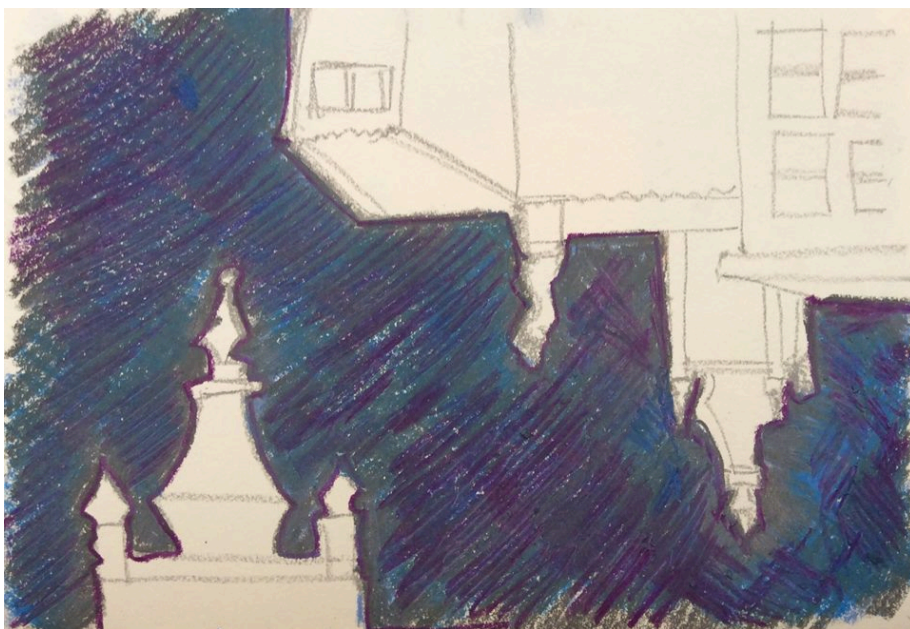
Negativo de Ouro Preto. Técnica: Pastel oleoso sobre papel canson, 2016.