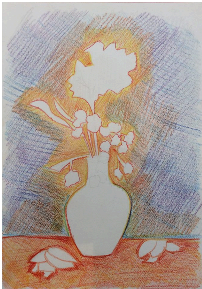
Negativo de natureza morta. Técnica: lápis aquarelável sobre papel canson, 2010.