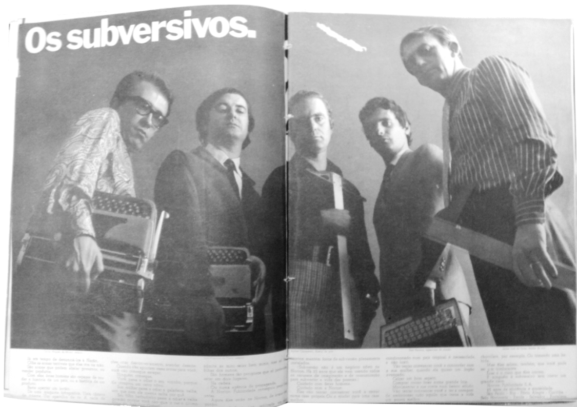
Figura 2 Anúncio da agência Norton. Propaganda, Ano XIV, nº 159. Agosto de 1969, p. 08-09. Biblioteca da Escola Superior de Propaganda e Marketing (ESPM-SP).

Aqui, exatamente como no caso do "terrorista", parte-se da representação do indivíduo de classe média engajado e de sua atuação política e social, para canalizar tais características ao mercado, de acordo com o que lhes interessa de fato. Assim como a mini-saia pode ser usada, "mas só nas filhas dos outros", a revolução e a subversão existem e são positivas – mas apenas enquanto revolução organizacional e subversão às regras estéticas, como meios para a expansão de mercado, expressão artística e de uma visão de progressismo social bastante limitada. Uma subversão que não se choca necessariamente com as boas relações entre diversas agências e o governo – paulatinamente ao longo do regime seu grande cliente, mas que por outro lado mantém viva a autorrepresentação do publicitário enquanto indivíduo (especialmente do setor de criação) como um rebelde.