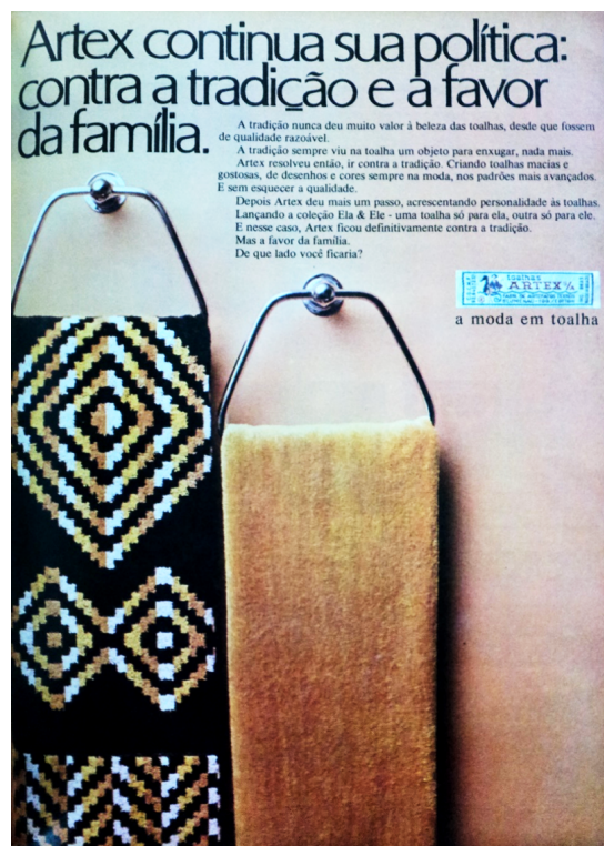
Figura 3 Anúncio da Artex. Manchete, Ano 20, nº 1058. 29 de Julho de 1972, p. 53. Biblioteca da FFLCH-USP.

também a publicidade devorava representações críticas ao regime, expressões da revolução sexual e comportamental que chegava ao Brasil em fins da década de 1960 e mesmo do ambiente político e da propaganda do regime e os ressignificava em prol do mercado e da busca profissional por uma estética inovadora.