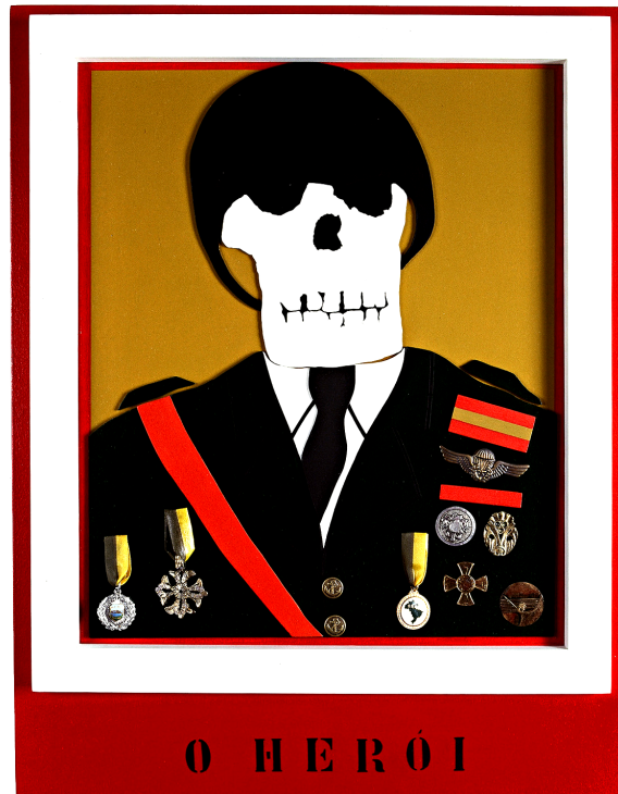
Imagem da capa O herói , assemblagem de Anna Maria Maiolino, 1966. A obra integrou a mostra Nova Objetividade Brasileira (Museu de Arte Moderna do Rio de Janeiro – MAM/RJ, 1967) e em seu cinquentenário foi doada pela autora para o Museu de Arte de São Paulo Assis Chateaubriand (MASP).