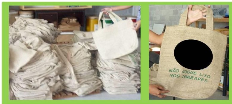
Figura 2: Sacolas ecológicas.