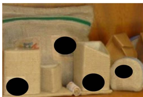
Figura 4: Produtos feitos a partir das sobras de fibras de juta.

Atualmente, a empresa conta com uma rede de supermercados da capital amazonense como principal comprador das sacolas ecológicas, além da Agência de Desenvolvimento Sustentável do Amazonas (ADS), que solicita os produtos feitos a partir das fibras de juta para utilizá-los em eventos locais, regionais e nacionais. O acompanhamento das vendas para esses e outros clientes está sendo realizado com o intuito de verificar a reação do mercado quanto à aceitação das sacolas de fibras de juta. Existe a pretensão de atingir o mercado consumidor da área que abrange a região amazônica legal e, principalmente, para exportação.