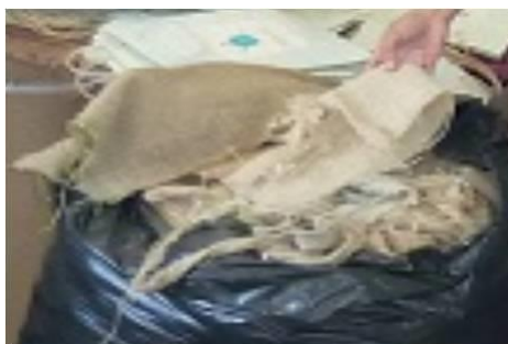
Figura 3: Sobras de fibras de juta.