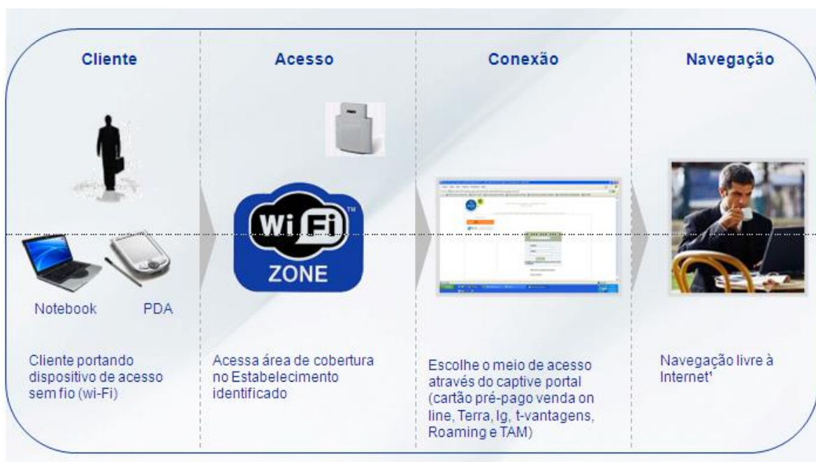
Figura 3 – Arquitetura do produto WI-FI

É uma solução de mobilidade e há rede de acesso em diversos estabelecimentos comerciais e lugares públicos. A empresa pesquisada é pioneira na implantação de redes sem fio com tecnologia WI-FI , contando atualmente com mais de 150 hot-spots instalados em cafés, universidades, shoppings centers, restaurantes, hotéis, centro de convenções e aeroportos. A rede de WI-FI da empresa está presente no Brasil e em diversos países da América Latina e Europa. Na Figura 3 é apresentada a arquitetura do produto.