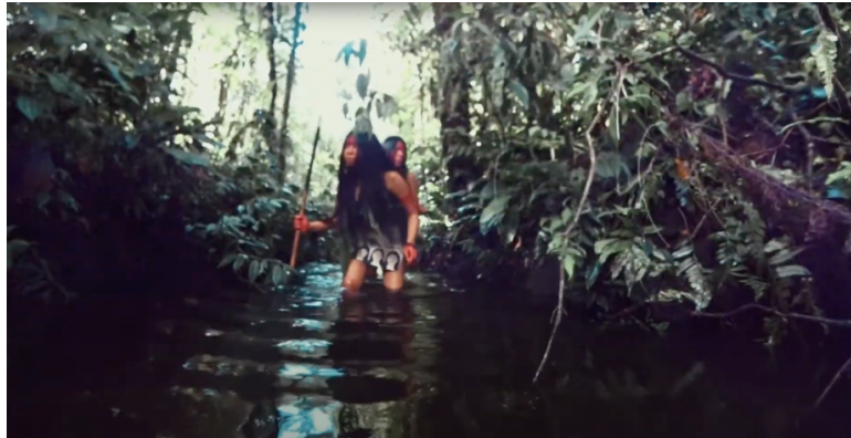
Figura 1- Mujeres acechadas por un sonido fuerte y atemorizante. Fotograma del filme Shun . 2021.