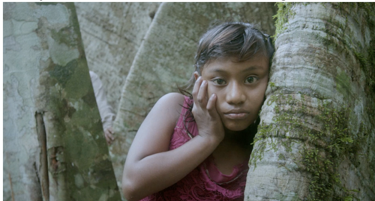
Figura 4- Niña Maya escucha el interior de los árboles. Fotograma del filme Yollotl . 2020.

FUENTE: YOLLOYL. Dirección: Fernando Colin Roque. Le Fresnoy - Studio national des arts contemporains. 2020. 19 min, digital. Disponible en: Vimeo, link privado del realizador. Consultado en: 14 ene. 2023.