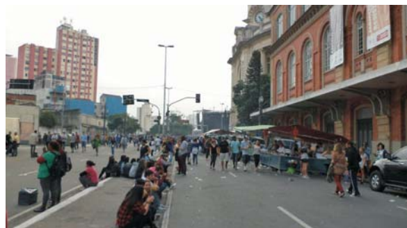
Imagem 2: Imediações da Estação da Luz – Virada Cultural.