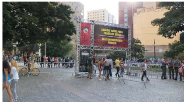
Imagem 6: Vale do Anhangabaú – Comemorações do Dia do Trabalho – Pórtico de acesso à área restrita.-2013.