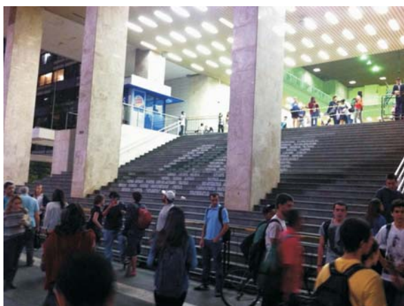
Imagem 12: Escadaria isolada do passeio público - Prédio da Gazeta. Avenida Paulista. 27/03/2014, 18:30.

Como exemplo, até pouco tempo, espaços símbolos da hospitalidade quase incondicional, a imensa escadaria do edifício da Gazeta, historicamente aberta como uma arquibancada urbana voltada para a Avenida Paulista e a acolhedora marquise do Parque Ibirapuera, ambas em São Paulo, têm tido sua apropriação disciplinada. Recente, a escadaria tem sido isolada do público com grades