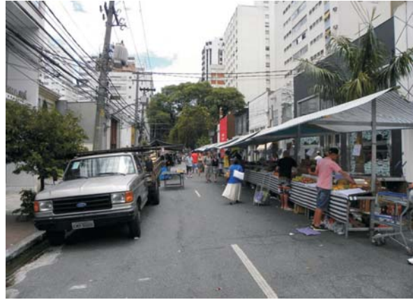
Imagem 11: Feira de rua semanal [aos domingos]. Alameda Lorena. A lógica de uma hospitalidade do convidado é substituída por uma hospitalidade do visitante. Públicos se misturam, barracas e lixo gerado pervertem momentaneamente o cenário dominante engendrado. Território endereçado a alguns se torna territorialidade do outrem.

Interessa-nos, assim, registrar o valor desse afeto proporcionado por alguns desses acontecimentos urbanos, periódicos ou não, que se tornam forças de alteridade ontológica, cognitiva, ética, ativadas pela própria lógica de produção urbana, mas com capacidade potencial tácita de desordem e, em virtude da persistência e da periodicidade, a promoção de inter-conectividades sociais outras [forças ativas, portanto, e não reativas] tornando-se locais muito próximos de manifestação de uma hospitalidade incondicional.