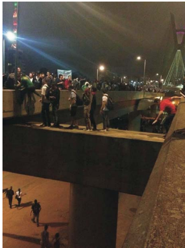
Imagem 9: Manifestação de Rua- Marginal Pinheiros- Ponte Estaiada- Perjúrio simbólico de um símbolo.