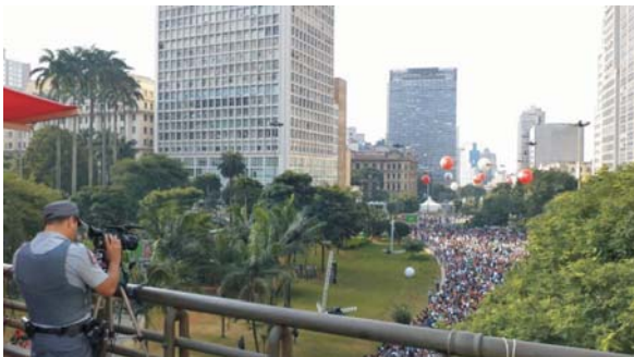
Imagem 5: Viaduto do Chá e Vale do Anhangabaú – Comemorações do Dia do Trabalho -2013. Prática da hospitalidade camuflada, intimidadora; uma expressão da “hostipitalidade” derridiana.