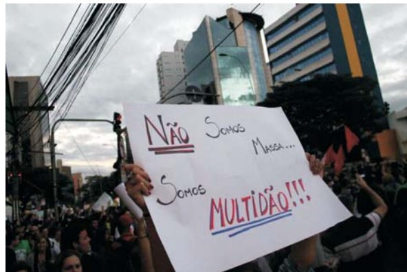
Imagem 7: “Não somos massa, somos multidão!!!” - Manifestação de Rua – Avenida Faria Lima.