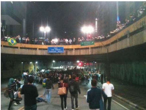
Imagem 8: Manifestação de Rua- Avenida Paulista.