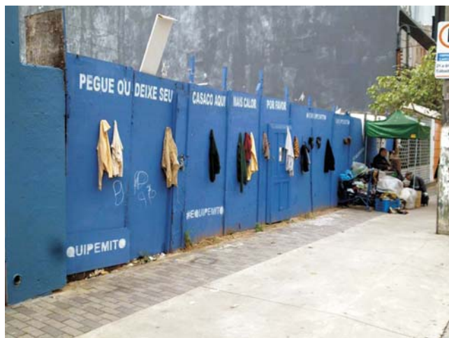
Imagem 4: Tapume de obra à Rua Fradique Coutinho usado como suporte público de casacos doados pela população