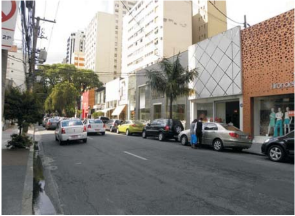
Imagem 10: Alameda Lorena, Jardins. Dia de semana. Lojas e butikues de grife criam cenário que investe em uma hospitalidade baseada no convite a seletos públicos.