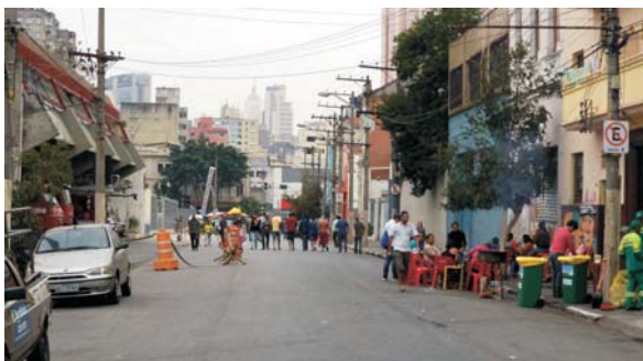
Imagem 1: Imediações da Estação Julio Prestes – um domingo à tarde.

Em algumas situações observadas, ligadas a atos comemorativos, de entretenimento, lazer e cultura, o estado parece, ao preparar, organizar e ordenar excessivamente o território, convidar e oferecer antecipadamente uma hospitalidade “camuflada” ao cidadão, tornando-o refém e suspeito em sua própria “casa”. Aquele que, originalmente, por direito, deveria não precisar de qualquer convite para usufruir e usar seu espaço, o espaço comum, o espaço de qualquer um, o espaço de todos, passa a ser convidado a entrar em um lugar onde não deveria haver dentro e fora, interior e exterior. Poderíamos indagar: a hospitalidade não se dá, ela se torna, como diria Derrida. Algo se torna hospitaleiro ao não exigir que aquele que chega tenha sido convidado a vir ou a adentrar. Algo se torna hospitaleiro pela indistinção entre aquele que supostamente convida - o hospedeiro - e aquele que é convidado- o hóspede. O cidadão não precisaria ser convidado a usar e usufruir da cidade, ao mesmo tempo em que a cidade o hospeda, ele também hospeda a cidade, pois, sem a cidade ele não seria um cidadão.