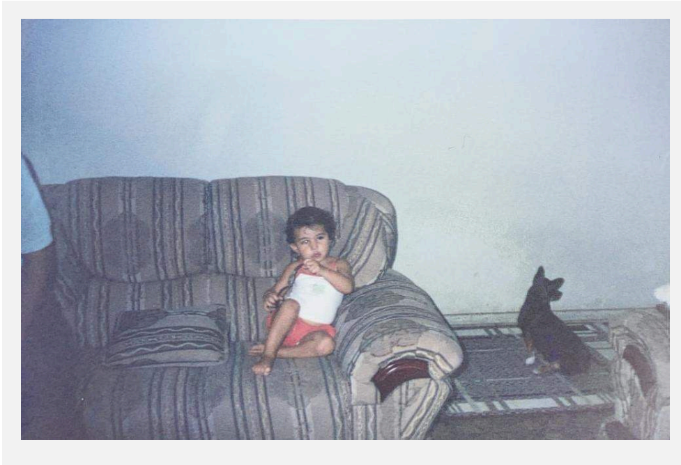
Fotografia feita em 2002, que mostra uma parte da sala de estar da casa de meus avós, parte de um dos braços de meu avô, eu, e a cachorra de estimação Luli.