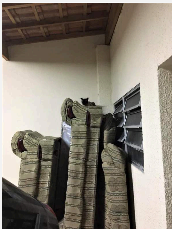
Fotografia feita em 2021, com intuito de mostrar Bidu, o gato de estimação, deitado no que antes foi a dupla de sofás da sala de estar de minha família, agora tombados na garagem.