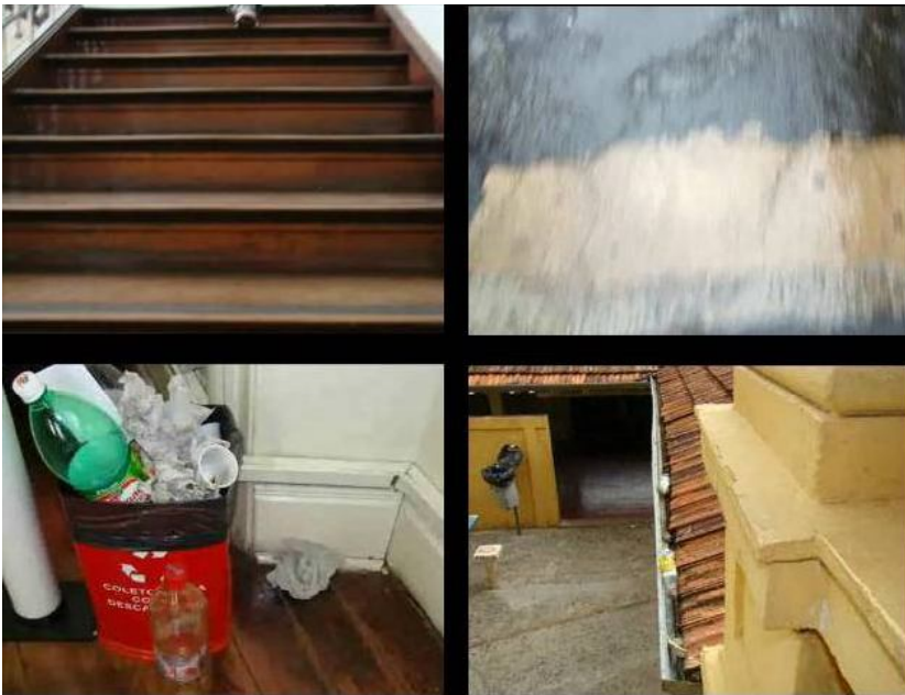
Figura 5 - Imagens paralisadas do vídeo 12 disponível em http://vimeo.com/3159001 .

Forças para o vazio, des-identidades em imagens de ambientes que abrem fissuras no círculo concêntrico da espiral da significação. “O que isso significa?” Aquilo. “E o que aquilo significa?” Aquele outro. E assim seguindo em uma infinita cadeia interligada de comparações e equivalências – o que, de acordo com Deleuze (2003), aponta o modelo platônico de mundo. O Seminário Multiplicimagens também pretendeu romper com essa cadeia fixadora de sentidos das imagens. Cadeia fixadora que, ao se quebrar, faz proliferar as potências de criação e instala a possibilidade de devir: imagens que passam a poder fabular. Fabular mundos, pensamentos, ambientes. Fugas como as cavoucadas por alunos e alunas 10 da professora de Biologia e Educação Ambiental Ionara Urrutia Moura, do Colégio Técnico de Campinas (Cotuca), quando produziram vídeos numa aposta em “esvaziar as imagens dos clichês”, como nos disse Amorim na reportagem, já citada, de Susana Dias 11 .