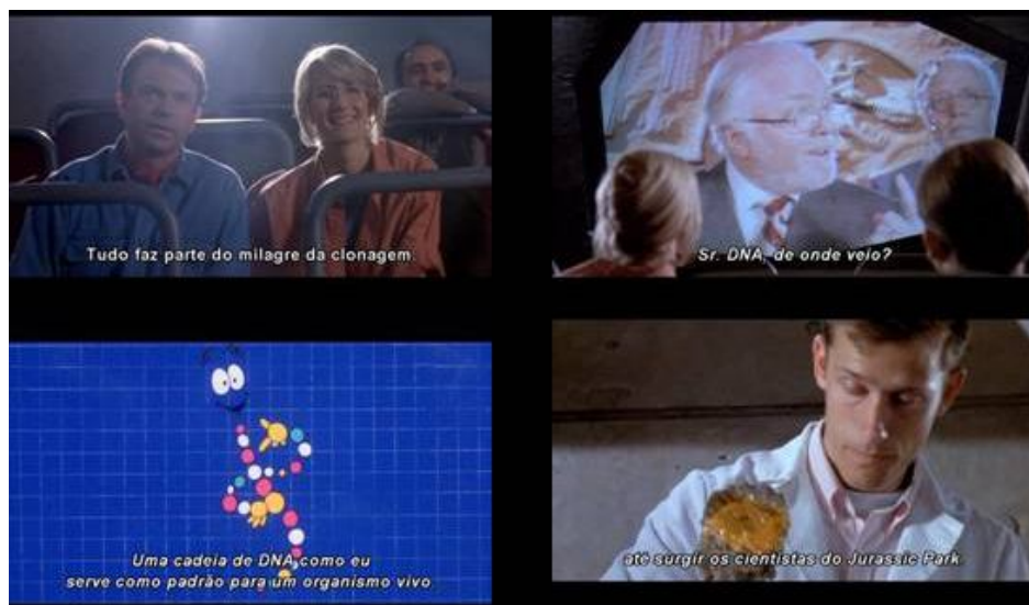
Figura 6 - Imagens extraídas da produção cinematográfica de Jurassic Park (1993), dirigida por Steven Spielberg.

Nesse projeto que eu comecei a ter o contato com Mata Atlântica e começar a trabalhar nesse universo de uma mata sem trilha, de começar a abrir trilhas e tudo mais; foi a minha grande escola, de começar a aprender a enxergar aquilo de uma maneira... de certa forma diferente do que você vê descrito nos livros. Porque eu fui para lá sem grandes embasamentos teóricos de todas essas teorias mirabolantes que a gente vê por aí e isso de certa forma foi bom porque eu não fui viciado para lá... A seqüência de imagens que eu posso te passar... são os caminhos das cem Matas Atlânticas que eu acabei percorrendo (SPEGLICH, 2009, p. 100).