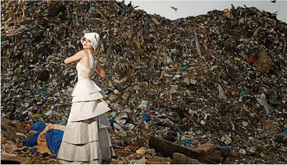
Figura 3 - Look Osklen Collection.

Figuras 1, 2 e 3 - Fotos: Cláudio Capri; moda: Denise Dahdah; produção executiva: Ricardo Oliveros; assistente de produção: Bruna Lobo; maquiagem: Cecília Macedo (GLLOSS). Revista QUEM, ed. 369, 03 de outubro de 2007. Disponível em: http://revistaquem.globo.com/Quem/0%2C6993%2CEQG1644247-6129%2C00.html . Acesso em 23/jun/2011.