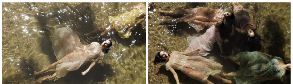
Figura 1: As Ofélias em Elena

“Para cada mulher nascida no século XIX, e ainda hoje, apresenta-se a questão de ser um sujeito” ou de “colocar-se como objeto do discurso do Outro, segundo os ideais de feminilidade construídos no mesmo período” (Kehl, 2016, p. 38). É sobre os dilemas dessa escolha que Elena parece reflexionar. Não por acaso, a imagem síntese da obra é uma releitura de Ofélia, personagem shakespeariana que se mata afogada, literal e figurativamente, “no rio de desejos e sensações, de excessos do sentir e do querer” (Brum, 2014, p. 19). Ofélia, para Márcia Tiburi (2010) é a figura da passividade, sempre referenciada pela fala de outros personagens de Hamlet , cuja morte – uma tentativa de fuga deste aprisionamento discursivo – sacraliza a imobilidade que lhe cabe na cultura dominante. “O corpo feminino se torna um corpo sem narrativa, sem história” (Tiburi, 2010, p. 315), vítima de uma alienação subjetiva. As Ofélias retratadas na obra de Petra Costa conjuram as mulheres cujos “anseios latentes não encontram lugar ou palavra” (Kehl, 2016), que sucumbiram no entrelugar de sujeito-objeto. A natureza feminina é o rio no qual, diante de uma encruzilhada, submergem, sem conseguir voltar à superfície.