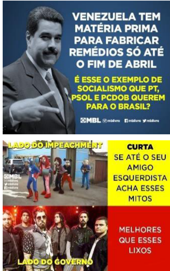
Figura 2 e 3 Conteúdos do MBL

Nota. Reproduzidos da página do MBL no Facebook, abril de 2016.