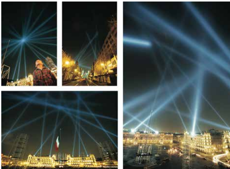
FIGURA 2 - Rafael Lozano-Hemmer, Alzado Vectorial, Mexico City, 1999-2000 – pessoas de todas as partes do mundo construíram essas estátuas de laser, uma a cada três minutos

É este o ambiente no qual as pessoas querem viver? Há claros sinais de uma demanda global por correção política, por prestação de contas, pelo uso justificado dos impostos, por meios efetivos de combate à pobreza, por negociações pacíficas etc. A imagem mundial dos regimes que ignoram tais valores é, doravante, decididamente diferenciada. Há evidência da ascensão de uma sociedade do compartilhamento, de movimentos prolongados que revelam a injustiça e a violência (Usuhadi, Aavaz). Pelo lado da sensibilidade, acima da presença dos movimentos verdes , que apoiam e transmitem valores globais, os primeiros sinais de formas de arte globais em novas tecnologias, são certamente um fraco sinal a ser considerado, pois a arte tem uma ação preditiva, embora em um nível quase homeopático, sobre o futuro. A arte tem um impacto muito sutil em nosso sistema límbico. Reflete e acelera igualmente uma sensibilidade global planetária que, de alguma forma, já existe em manifestações incipientes.