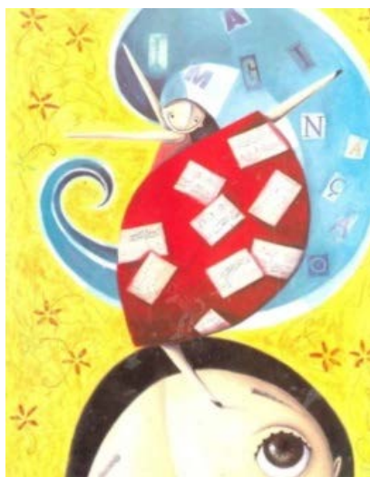
Recorte da obra Maria Mole .

A intenção do narrador é motivar o leitor a forjar seus próprios valores por meio do estado de espírito da personagem, engajando-o de maneira ativa e participativa na atribuição de significados à obra, como se pode observar a ilustração abaixo: