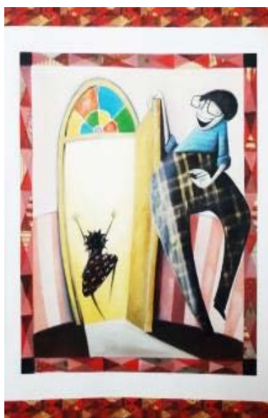
Recorte da obra Maria Mole. Fonte: Neves, 2002, p. 23.

“versos alegres cheios de alegria” no intuito de demonstrar o que “naquele momento era importante e o que poderia esperar” (NEVES, 2002, p. 22). E o resultado foi satisfatório: finalmente seu pai a deixou brincar com seus amigos na rua. Na imagem abaixo, o pai de Maria mostra-se alegre em permitir que a filha saia para brincar. Ao observá-lo, é possível identificar a semelhança das cores das roupas da Maria de antes (triste, cinza e melancólica) e de seu pai (roupa azul e estampa listrada), levando o leitor a compreender que a personagem se vestia exatamente como pai, pois até a forma de se vestir era-lhe imposta pela família.