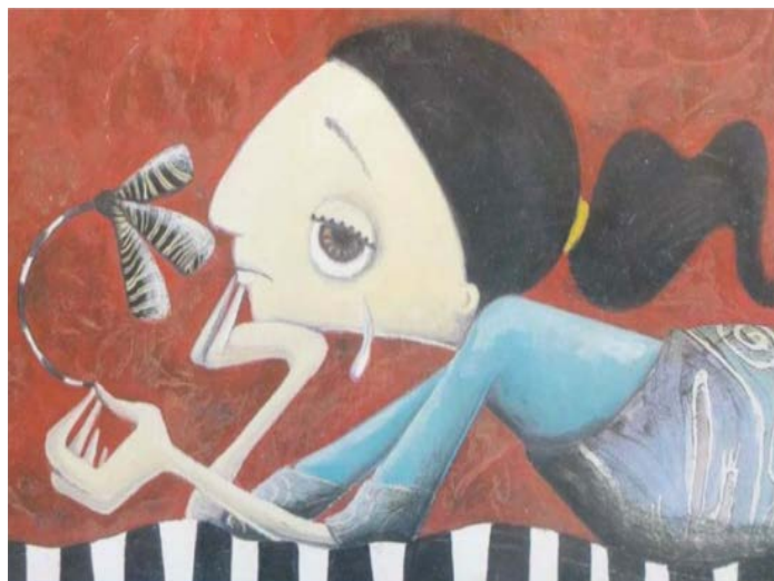
Recorte da obra Maria Mole. Fonte: Neves, 2002, p. 08.

O cabelo amarrado por uma presilha clarinha esconde o verdadeiro “eu” de Maria. A melancolia no olhar, a fisionomia abatida evidencia o estado psicológico da personagem. É nesse momento que entra em cena a função expressiva da ilustração (já explicitada no capítulo 2), que revela traços da personalidade de Maria, como a tristeza, a dor, a solidão e o medo, evidenciada pela flor murcha e sem cor em sua mão. Nesta função, a ilustração exerce um papel de grande importância para o leitor, posto que influencia na construção de seu juízo de valor sobre a narrativa. O leitor consegue vislumbrar o estado psicológico de Maria pelo gesto de segurar o queixo com as mãos, como de quem não espera nada entusiasmante da vida nesse momento. É um gesto que pode indicar ainda questionamentos da personagem sobre a própria vida em um dado momento reflexivo sobre si mesma. As lágrimas que caem dos seus olhos entreabertos indicam profunda tristeza. A roupa monocromática e sem detalhes revela uma criança insatisfeita com a vida, como se pode observar na imagem seguinte, na qual Maria aparece escorada a uma flor gigante, mas que não liga para o fato de estar perto de uma grande e linda flor colorida.