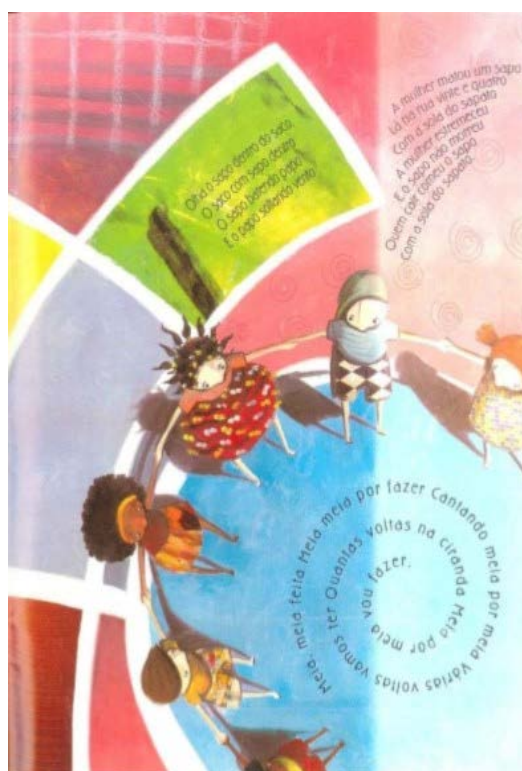
Recorte da obra Maria Mole.

Ao chegar perto dos seus amigos, Maria brinca “cheia de ousadia”, enquanto os demais se entregam aos poucos ao seu jeito “esquisito, estranho, mas divertido de ser” (NEVES, 2002, p. 24). Maria era diferente apenas do que as crianças costumavam ver.