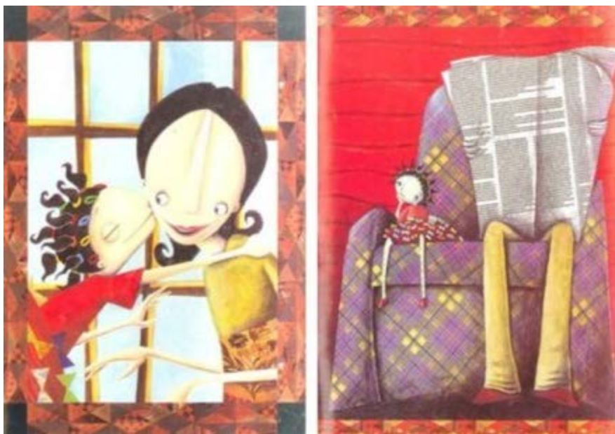
Recorte da obra Maria Mole.

ra pessoa a ganhar um “beijo gostoso” da nova Maria, que acabou cedendo aos seus encantos, pois a alegria de Maria é tão contagiante, que as pessoas com as quais ela convivia também receberam-na. Após encantar a mãe, sai em busca do pai para que a deixe brincar com seus amigos na rua. No entanto, o pai permaneceu como estava: sentado, lendo o jornal, sem dar atenção à filha. Maria pôs-se a sentar e a imaginar porque o pai não teve a mesma reação de sua mãe. Nas imagens abaixo, Maria beija sua mãe com entusiasmo e alegria, deixando sua mãe feliz e surpresa ao mesmo tempo, pois sua mãe não retribui o abraço ao se observar que a mesma não utiliza as mãos. Na primeira imagem, evidencia-se os detalhes da roupa de Maria, como os laços e as inúmeras fivelas coloridas. O pai de Maria permanece sentado e lendo o jornal, sem dar importância à nova Maria que está sentada ao seu lado. Maria pôs-se a pensar.