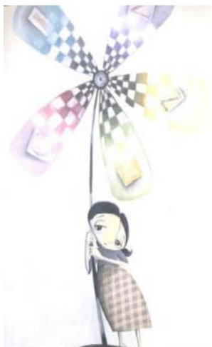
Recorte da obra Maria Mole.

Na imagem acima, observa-se que a flor tem em suas pétalas as letras que formam a palavra “CINZA”, demonstrando que essa era a cor que vigorava na vida de Maria. A maneira de ser da personagem incomodava os que conviviam com ela, era contrariada por sua mãe quando tentava demonstrar sua vontade quanto aos seus gostos, os modos de se vestir. O seu pai era estranho, calado, com olhar baixo e não deixava Maria sair para brincar. Dentro da sua própria casa, Maria tinha espaço e tempo delimitados para brincadeiras.