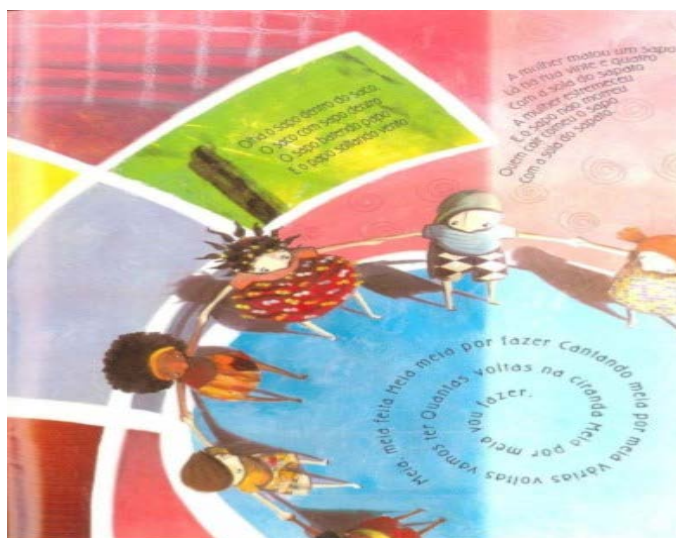
Recorte da obra Maria Mole.

No canto direito da mesma ilustração temos outra cantiga de roda, desta feita num movimento como se saíssem do meio da roda das crianças: “A mulher matou um sapo/ Lá na rua vinte e quatro/ Com a sola do sapato/ A mulher estremeceu/ E o sapo não morreu/ Quem cair comeu o sapo/ Com a sola do sapato” (NEVES, 2002, p. 25).