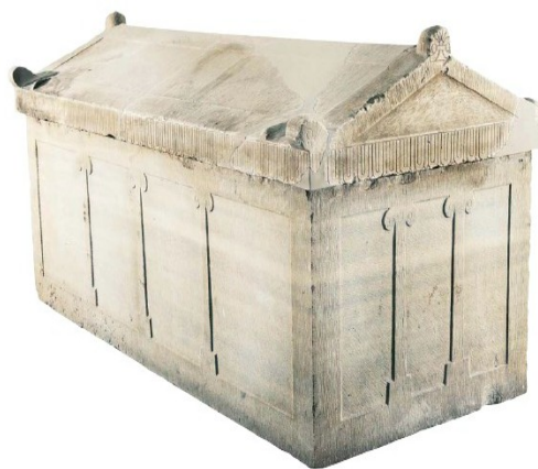
Figura 2 - Sarcófago em mármore, provavelmente de Aiakes, pai de Polícrates (TSAKOS e SOFIANOU, 2012, p. 215).

Foi descoberto que desde a Idade do Bronze havia práticas de culto no santuário (DINIZ, 2011, p. 31). Porém, existe uma au-