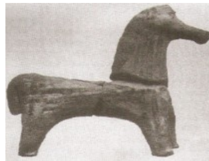
Figura 3 - Miniatura de cavalo encontrada no Heraion (Kyrieleis, 1993).

A análise da quantidade das oferendas votivas presentes no santuário possibilita levantar considerações sobre os frequentadores do local sagrado e, dessa forma, sobre as características e funções do culto realizados em homenagem à deusa. Para tal, iremos utilizar dois principais tipos de oferendas, miniaturas de cavalo e de gado. Assim como é apontado por Diniz (2011, p. 34), o cavalo também foi para os gregos um animal de luxo, andar de cavalo era uma atividade voltada para a aristocracia. Já o gado é ligado à vida do campo 10 . Antes de apresentar a análise