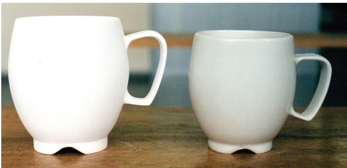
Figura 2 – Retração e deformação de peça com alto grau de fase vítrea: à esquerda, após a queima de biscuito a 1000°C; e à direita, após a queima de vidrado a 1250°C, com tamanho reduzido e alça levemente caída (AUN, 2007).

Todos esses conhecimentos são considerados durante o projeto. Os desenhos para produção