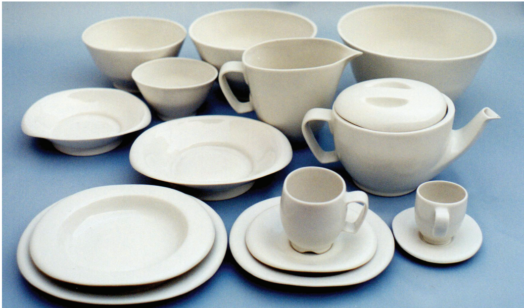
Figura 3 – Configurações abertas, com parede fina, das tigelas e travessas favorecem deformação, enquanto configurações fechadas das xícaras e bule do aparelho orbital sofrem menos deformações durante o processo de fabricação (AUN, 2000).

levam em conta a retração e a possível deformação da peça. As matrizes de gesso são realizadas a partir deles. Com os desenhos e as matrizes, é feito o planejamento para a construção do molde de gesso, conforme apresentado na Figura 4, em número de partes necessário para garantir a retirada da peça, evitando forçar a saída e provocar deformações que, mesmo quando corrigidas na peça crua, revelam o ocorrido após a queima, inutilizando-a (CHAVARRIA, 2006).