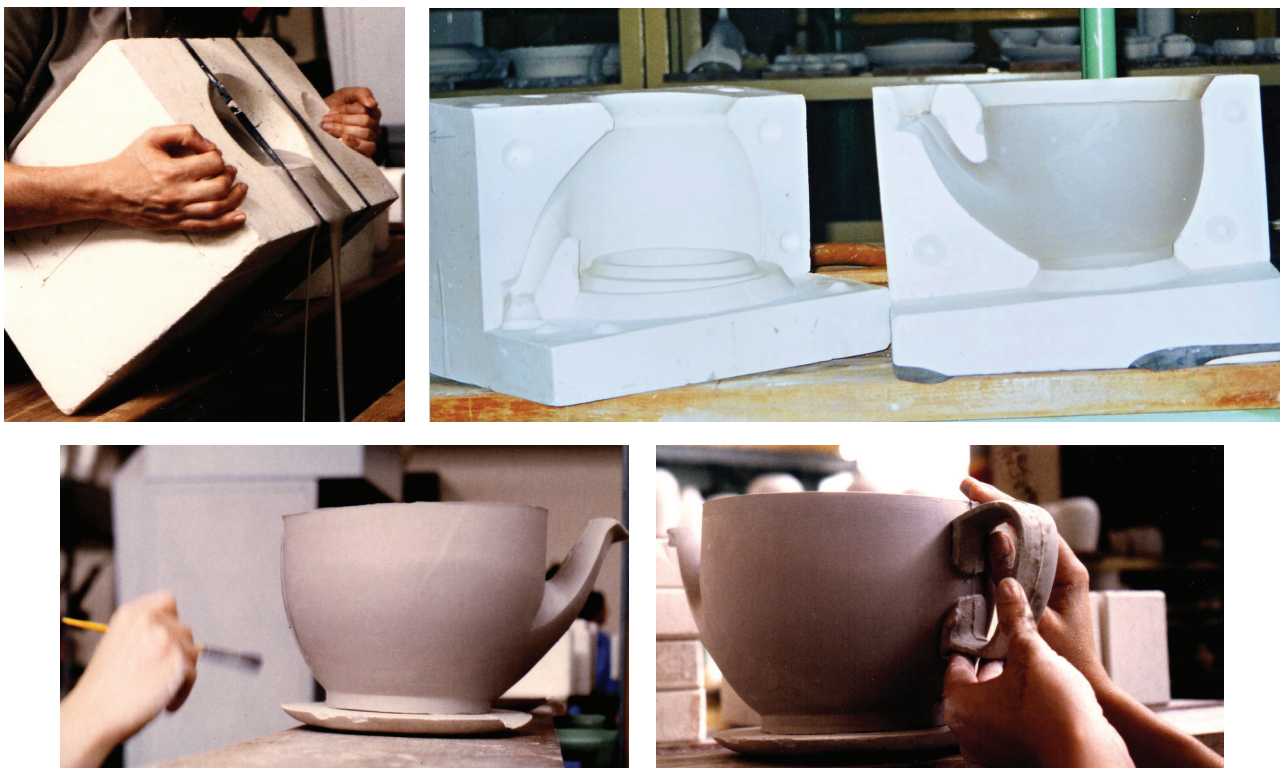
Figura 1 – Conformação por colagem em moldes de gesso e união de partes antes da queima.

Os produtos cerâmicos confeccionados por processos tradicionais apresentam baixa complexidade tecnológica. São produtos simples, compostos por poucos elementos. As partes são unidas logo após a conformação, antes da queima (Figura 1). Alguns produtos possuem tampas feitas do mesmo material e que são montadas para exposição no ponto de venda ou quando são colocados em uso. Maior ênfase pode ser dada na compreensão da geometria das peças, no volume desejado, nos atributos estéticos, manifestados na forma tridimensional, no acabamento superficial, no uso de cores e nos recursos de decoração.