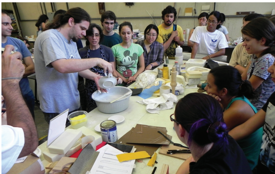
Figura 5 – Vidração de peças por imersão, empregando-se um vidrado branco brilhante para queima a 1250°C.

uso de determinados produtos e sobre costumes e comportamentos sociais no desenrolar de atividades cotidianas. A temática trabalhada na disciplina envolveu o desenvolvimento de um kit de alimentação para viagem de uso individual, abordando questões sobre a necessidade de se comer fora de casa, o tempo exíguo disponível que desencoraja o preparo de alimentos no ambiente doméstico, a disponibilidade de produtos alimentícios para suprir essa falta e mudanças de hábitos e ritos relacionados ao comer. Esse tema proposto está alinhado à familiaridade dos alunos com o problema enunciado em razão