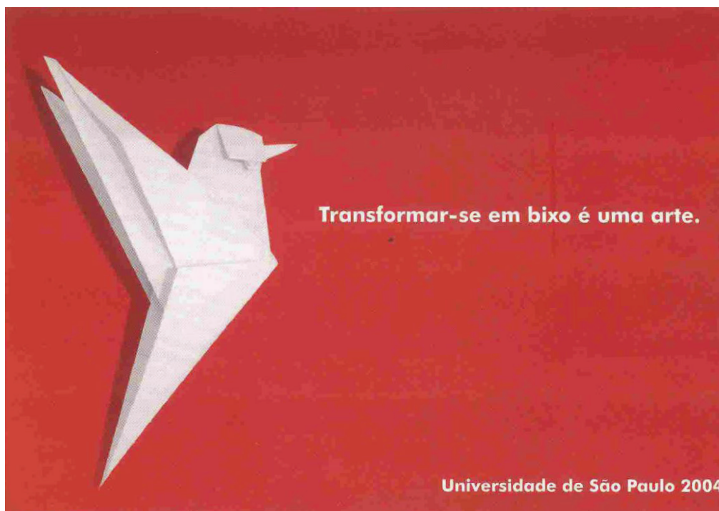
Imagem da Campanha de Recepção aos Calouros de 2004, cujo tema era “Transformar-se em bixo é uma arte”.

O cliente é a Pró-reitoria de Graduação. É ela a responsável pela coordenação das ações