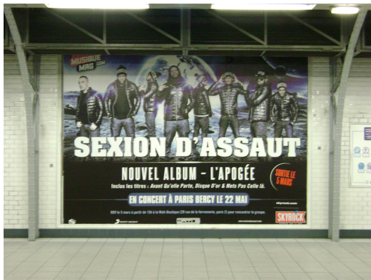
Foto 4 – Divulgação massiva no circuito rap das grandes gravadoras, estação de metrô Duplex, Paris