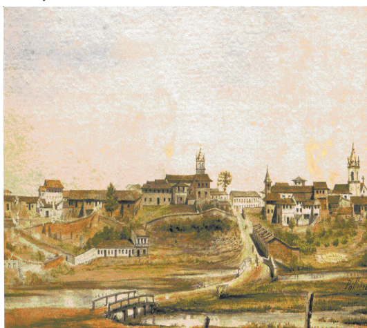
"Dezenho por Idea da cidade de São Paulo" Aquarela anônima, séc. XVIII (Fig.03) e "Varzea do Carmo" aquarela sobre papael. Pallière (Fig.04)