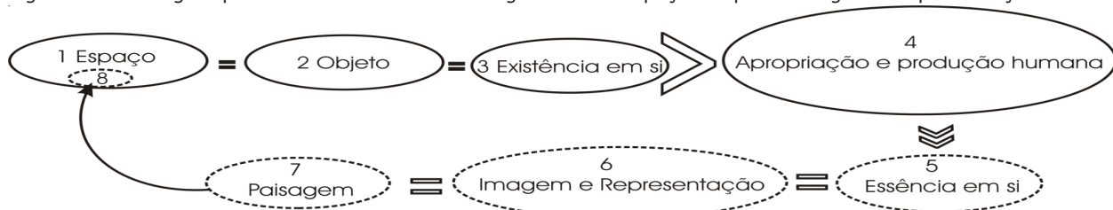
Figura 1. A Paisagem possui uma identidade de origem com o espaço do qual é imagem e representação.

(1) O Espaço como objeto de estudo da Geografia é, ele mesmo, um (2) objeto , ou conjunto de objetos , que possui uma (3) existência em si , isto é, existe no real independentemente da existência humana. O Homem, porém, têm a possibilidade de proceder, através da (4) apropriação e produção humana do espaço, a teorizações da (5) essência em si deste mesmo espaço advindas da faculdade de pensar sua relação cognitiva com o meio. Este espaço teoricamente pensado se materializa por meio da (6) imagem e representação que o homem faz da essência em si deste mesmo espaço. Esta imagem e representação do espaço é o que chamamos de (7) Paisagem . Esta paisagem, logo, tem sua origem num determinado (8) fragmento do espaço , que é sua identidade de origem com o (1) Espaço que verdadeiramente existe como objeto da geografia.