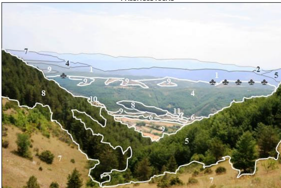
Figura 4 SELLANO: VISÃO PANORÂMICA DAS ARTICULAÇÕES ENTRE AS UNIDADES AMBIENTAL-PAISAGÍSTICAS

Numa fotografia panorâmica de Sellano tomada no sentido de oeste para leste, mostra-se como se dão as articulações entre as unidades ambiental-paisagísticas.