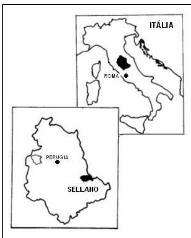
Figura 1- SELLANO: LOCALIZAÇÃO E POSIÇÃO GEOGRÁFICA

A peculiaridade geográfica mais evidente do território municipal consiste na sua situação, que se coloca como intermediária entre o Vale Valnerina, ao sul, e os Planaltos de Colfiorito, depressões de origem cársico-tectônica, ao norte, o que fez com que no passado, Sellano representasse um importante entroncamento de itinerários que, através do Vale do Rio Vigi, ligavam Valnerina com Foligno e Camerino e atingiam Spoleto ao longo da antiga Estrada da Spina, via de origem proto-histórica vinculada à transumância. [Fig. 1]