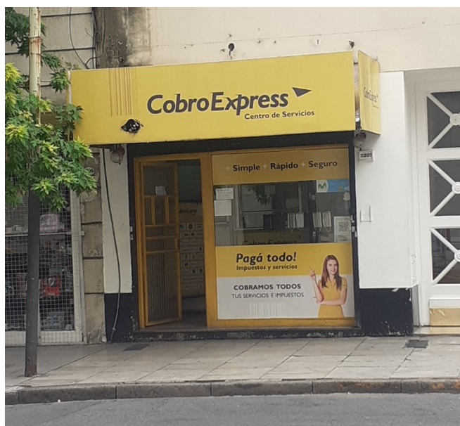
Figura 4 – Cobro Express, Juncal y Azcuenaga, Recoleta, Buenos Aires/Argentina.