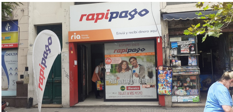
Figura 3 – Rapipago na Avenida de Mayo, Buenos Aires/Argentina.