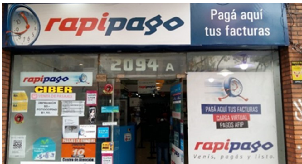
Figura 6 – Marca da Rapipago. A velocidade como símbolo. Abasto, Buenos Aires, Argentina.

e ordens de serviços e, também, a compra de mercadorias como refrigerantes, sucos e doces, além da recarga de bilhetes de transporte.