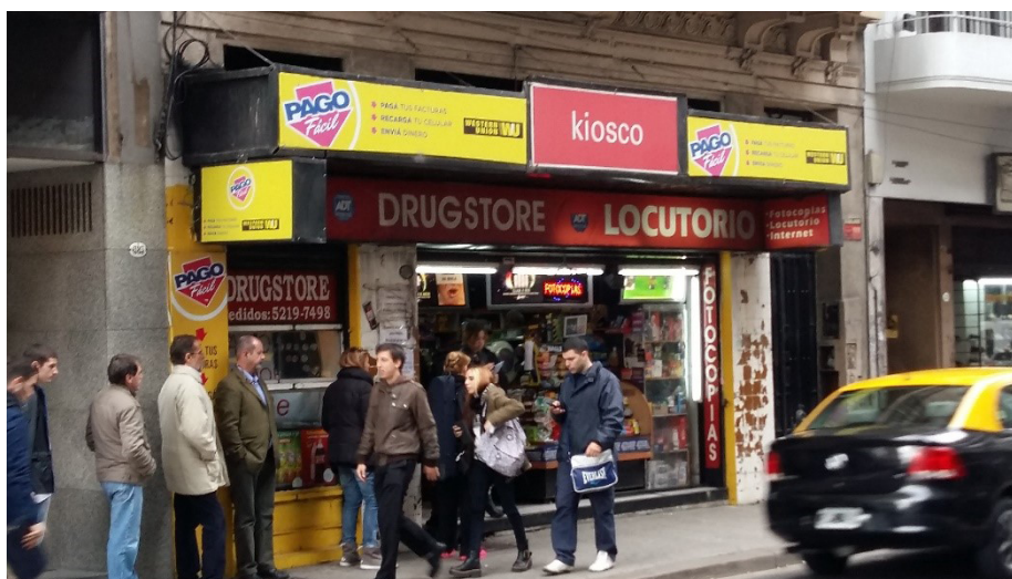
Figura 5 – Pago Fácil, Centro, Buenos Aires/Argentina.

viver, de produzir e de consumir. A tecnologia de pagamentos bancários em empresas terceirizadas deram uma nova organização às ruas de Buenos Aires (Figura 5).