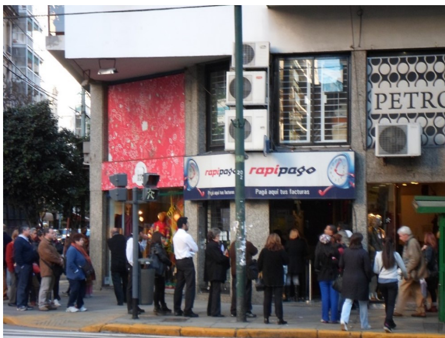
Figura 2 – Avenida Santa Fe, Recoleta, Buenos Aires – Argentina.

No que se refere às escolhas de localização das empresas ligadas à oferta de serviços financeiros na cidade de Buenos Aires, ressaltamos a presença de comércios bancários em grandes avenidas e pontos de intensa circulação, configurando pontos ideais para tais atividades (Figura 2).