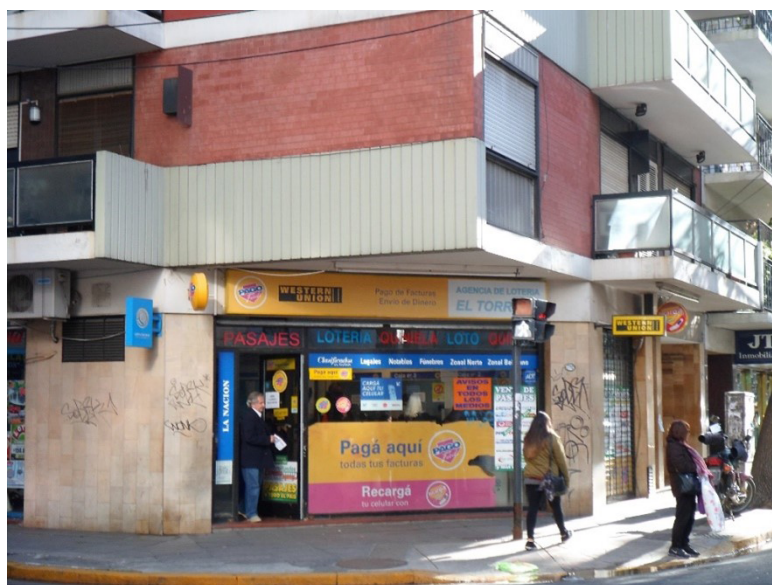
Figura 1 – Pago Fácil com oferta de diversos serviços. Recoleta, Buenos Aires – Argentina.