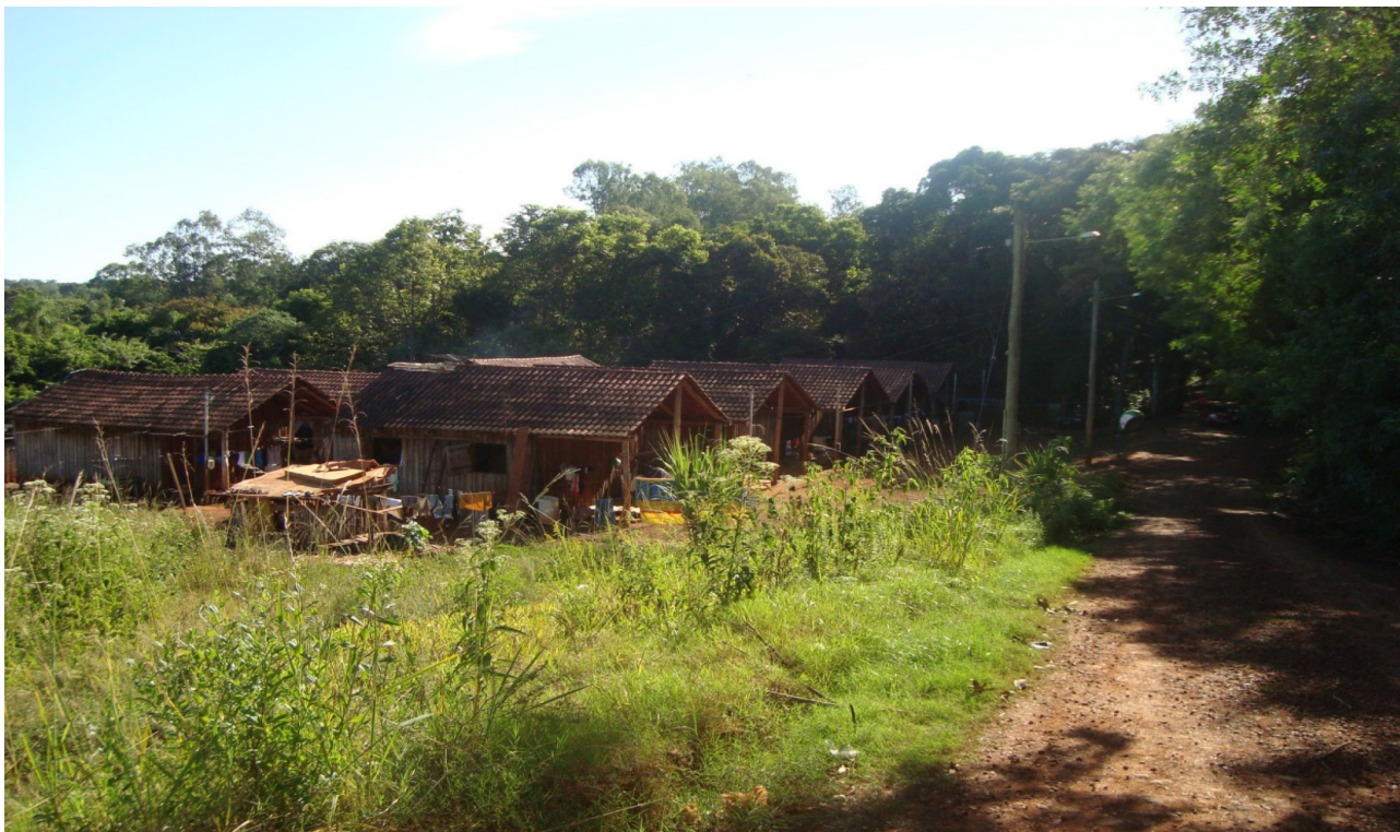
Figura 3 – Vista parcial das casas da terra indígena Foxá