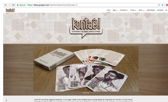
[Figura 3] – Captura de tela do site desenvolvido para o jogo Kontaê!

jogo, permitindo jogar utilizando conexão à internet, via celular com QR Code ou off-line com material previamente impresso a qualquer pessoa que tenha interesse em utilizar o Kontaê! como suporte lúdico às aulas de história ou apenas como diversão instrutiva, quebrando a lógica capitalista de lucro nos jogos online .