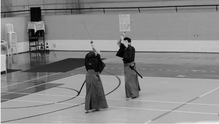
Figura 3 – Praticantes apresentando o Nippon Kendô Kata

O Nippon Kendô Kata em ocasiões oficiais como abertura de competições ou apresentações formais é apresentado com espadas em metal sem corte. Nesses eventos a vestimenta também muda, os praticantes usam montsuki 紋付, obi 帯 e hakama (figura 3) (ALL JAPAN KENDO FEDERATION, 2002).