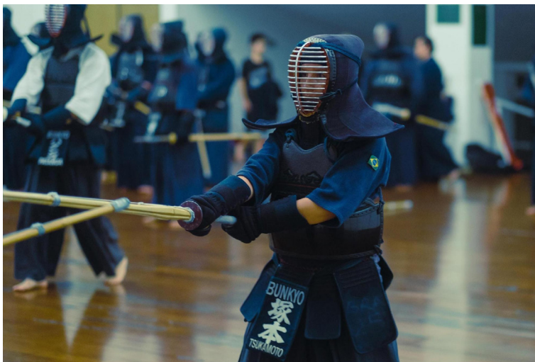
Figura 1 – Praticante de Kendô usando uniforme, bôgu e shinai