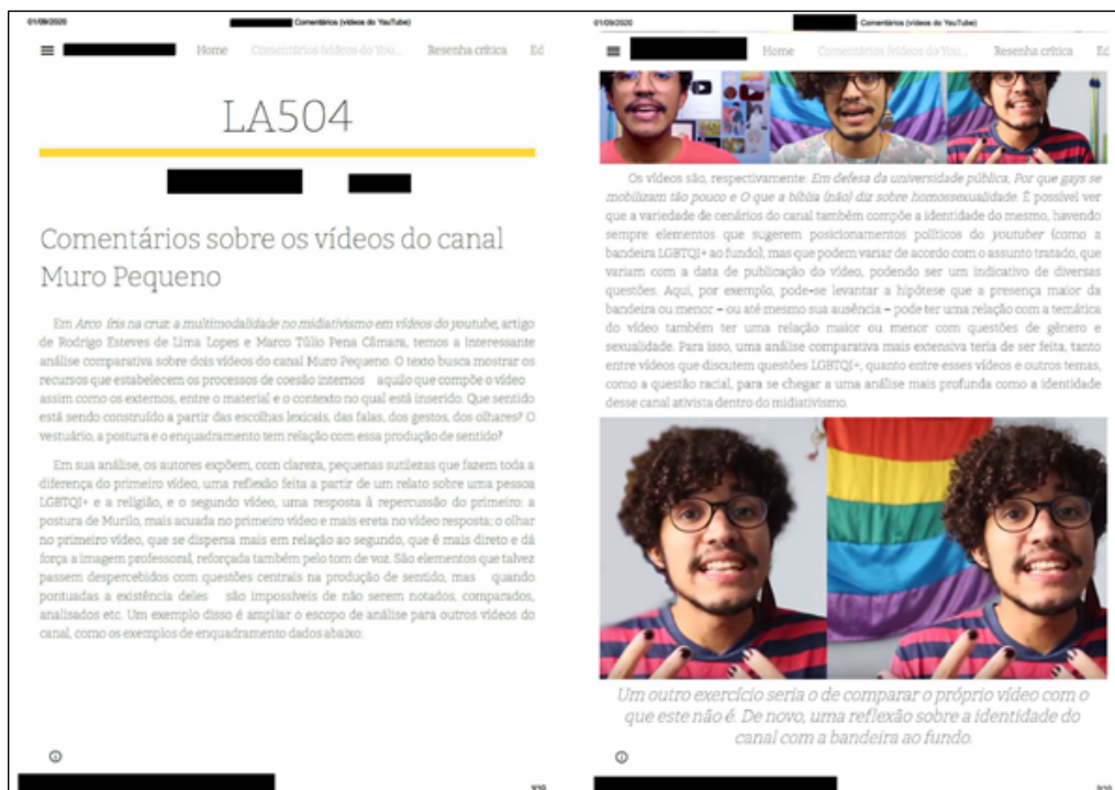
Figura 3: Exemplo de notícia de divulgação científica

Outros formatos apresentados pelos alunos durante o curso são o infográfico (ver Figura 4) e a postagem para stories do Instagram (Figura 5). No caso do primeiro formato, a aluna realizou uma sistematização de três textos para leitura de forma comparativa e sintética. A iniciativa, apesar de não se repetir, foi impactante nos demais alunos do curso, que declararam utilizar o material para compreensão dos textos. Do ponto de vista da análise de linguagem, tal formato levou a mobilização de uma importante capacidade tradutora, uma vez que houve a necessidade de transposição dos textos da linguagem acadêmica para a linguagem casual, e de síntese, uma vez que o texto produzido no infográfico traz apenas alguns dos elementos principais dos textos.