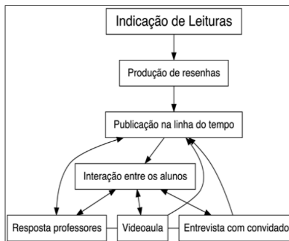
Figura 1: Fluxograma de trabalho no curso

Após a reformulação do cronograma, solicitava-se aos alunos a leitura de textos relacionados aos novos temas, a fim de que produzissem as resenhas com liberdade para se organizarem em grupos com quaisquer números de integrantes, sendo que o formato de entrega da resenha poderia ser aquele que o grupo escolhesse. A ideia por trás de tal liberdade era de responsabilizar os alunos pela seleção do gênero, formato ou suporte que melhor traduzisse suas ideias e o fato do professor e o monitor de pós-graduação da disciplina serem comunicólogos tornou possível discutir configurações diferentes daquelas que os alunos estavam habituados, quando isso se fez necessário.