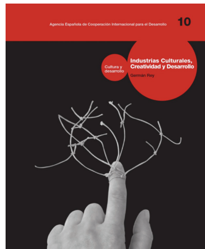
Figura 1: Industrias culturales, creatividad y desarrollo , de Germán Rey, 2009

La cultura siempre ha tenido entre sus características el ser uno de los ámbitos de la resistencia. También es cada vez más un campo de derechos, tensiones y expresividad. Pero no creo que esté llamada a reemplazar a la política. Si a darle nuevos sentidos al ejercicio de la política sobre todo en tiempos en que crece la desconfianza y el escepticismo de los ciudadanos. Un hecho muy interesante fue la movilización de diferentes sectores de la cultura cuando el gobierno actual tomó como una de sus primeras medidas la supresión del Ministerio de Cultural. No se puede suprimir lo que se ha convertido en un capital simbólico de los ciudadanos y ciudadanas.