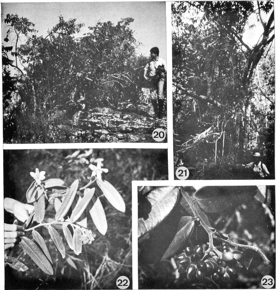
Figs. 20-23 - Guatteria notabilis Mello-Silva & Pirani: 20 - Árvore crescendo entre grandes rochas, na Serra do Cabral, 21 - Árvore crescendo num capão, em Grão-Mogol; 22 - Ramo com flores e frutos; 23 - Ápice de ramo com frutos (20,23. Mello-Silva et al. CFCR 8062, 21,22 Pirani et al. CFCR 11.146).

Figs. 20-23 - Guatteria notabilis Mello-Silva & Pirani: 20 - Tree growing among rocks, in the Serra do Cabral; 21 - Tree growing on forest in Grão-Mogol; 22 - Shoot with fruits; 23 - Shoot with fruits (20,23. Mello-Silva et al. CFCR 8062, 21,22. Pirani et al. CFCR 11.146).