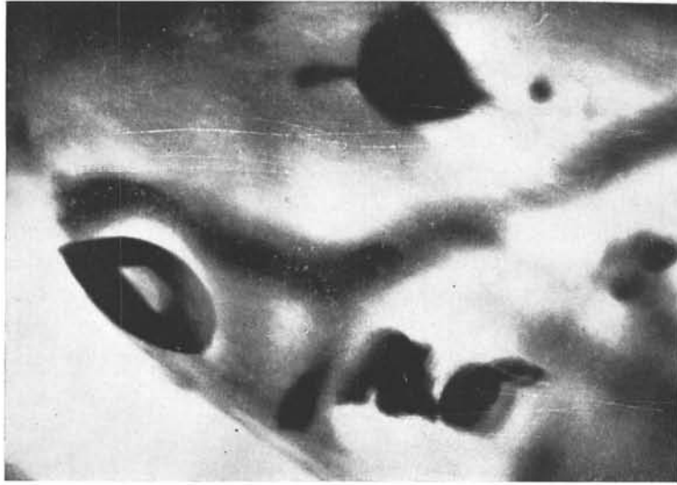
a) 100 x