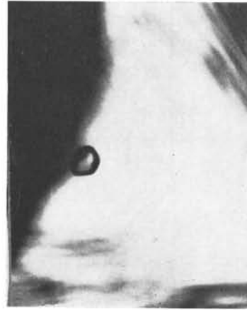
c) 10 x

Fotomicrografia 1 — a) Cristal de diamante contendo diversas inclusões, destacando-se no lado esquerdo uma inclusão de enstatita prismática. As demais em níveis diversos são olivinas. As manchas escuras irregulares que circundam as inclusões correspondem à zona de birrefringência anômala do diamante hospedeiro. b) Inclusão de granada em primeiro plano ao lado de uma olivina de forma abanhada. c) Inclusão de olivina visível a olho nú. Notar o idiomorfismo bem definido de todas as inclusões. As manchas negras de (b) e (c) correspondem à fenômenos de reflexão total.