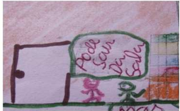
Desenho 5: Sujeitos que se diferenciam dos demais.

A exemplo de Homem de Ferro e Mônica , Superman pontua adultos em sua produção, no entanto, diferente dos outros dois que apresentam apenas uma figura, sendo um do sexo masculino no grafismo de Homem de Ferro e outro do sexo feminino na elaboração de Mônica , Superman evidencia adultos dos dois sexos ao mesmo tempo. Aspecto este que também pode ser observado na produção de Homem Aranha .