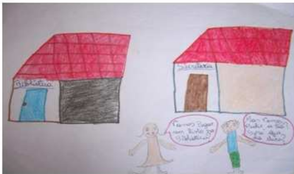
Desenho 1: Mulher Maravilha.

Nesse sentido, a seguir apresentamos as imagens elaboradas e explicadas pelos alunos à medida que foram solicitados a explicarem sobre seus desenhos.