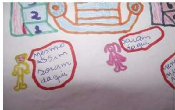
Desenho 6: Sujeitos que se diferenciam dos demais.

Diferente de Homem de Ferro e Mônica , Superman e Homem Aranha a nosso ver demonstram mais claramente a questão de gênero em suas produções, já que colorem tanto a figura masculina e feminina com cores socialmente internalizadas como cor de homem e cor de mulher, afirmação esta que pode ser embasada pelo discurso dos interlocutores em questão, quando foram instigados a responderem o porquê de terem pintado aqueles sujeitos com cor de rosa (mulher) e de verde ou amarelo (homem), como observarmos a seguir: