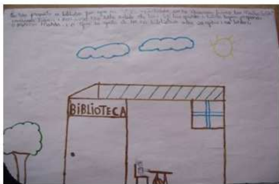
Desenho 7: Goku.

Neste recorte, percebemos claramente a insatisfação do aluno, tendo em vista que o mesmo argumenta no desenho suas intenções de usabilidade no espaço da biblioteca.