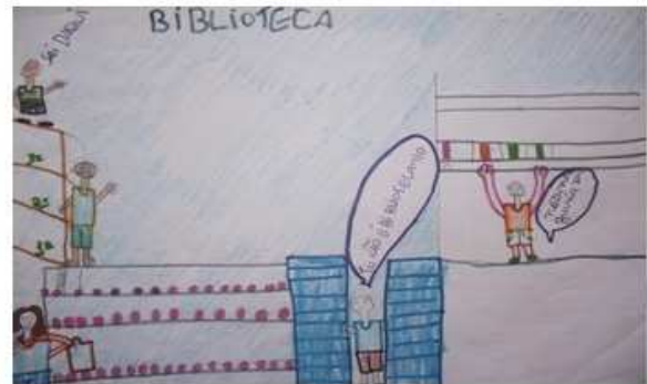
Desenho 2: Homem de Ferro.

Mulher Maravilha ao se retratar no desenho e dialogar com uma colega por meio de balões, põe em evidência a questão do empréstimo de livros por meio de uma dúvida: Será que a tia deixa levar para casa? . A mesma ressalta a secretaria como o espaço para a permissão deste, o que nos faz inferir através da diferenciação das estruturas prediais, que a aluna não concebe os dois espaços grafados como únicos dentro de um contexto maior que é a escola e, principalmente, a biblioteca como responsável por este serviço. Em relação ao exposto, Silva (2009) compreende a biblioteca como a responsável pelo empréstimo das obras e afirma que a razão desta está diretamente relacionada ao empréstimo.