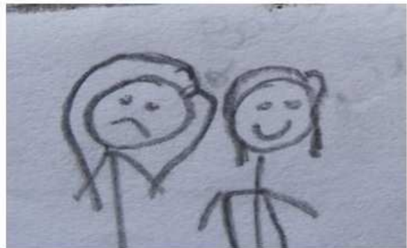
Desenho 4: Contorno da boca voltado para baixo.

A primeira foi desenhada com o rosto sem contornos e colorido de cor preta, enquanto que, a segunda apresenta o contorno da boca voltado para baixo, por isso questionamos a