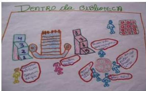
Desenho 6: Homem Aranha.

A exemplo de Homem de Ferro e Mônica , Superman pontua adultos em sua produção, no entanto, diferente dos outros dois que apresentam apenas uma figura, sendo um do sexo masculino no grafismo de Homem de Ferro e outro do sexo feminino na elaboração de Mônica , Superman evidencia adultos dos dois sexos ao mesmo tempo. Aspecto este que também pode ser observado na produção de Homem Aranha .