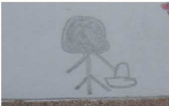
Desenho 4: Ausência de contorno no rosto.

Abaixo, em nossa observação inicial estas produções se ressaltaram pela forma como a aluna nos apresenta no grafismo.