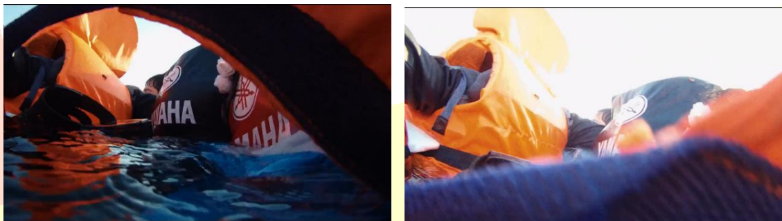
Imagens 3 e 4 – frames da câmera emergida em Purple Sea (2020)

evidente na figura 2, acima. É possível ver que são pessoas, mas apenas pela sequência de faixas de cores que lembram tons de pele e roupas pretas. Já em Purple Sea , a má qualidade da imagem aparece devido à condição de filmagem. O ano de produção é 2020, o contexto de produção é favorecido por aparatos técnicos e formas de apropriação que fazem com que a nitidez esteja muito melhor do que em 2004. Contudo, devido ao fato de a câmera acompanhar o movimento do corpo da realizadora, os corpos à deriva, a água, o céu e os botes salva vidas são oferecidos ao nosso olhar como formas abstratas. É possível ver apenas partes do que foi capturado, nunca vemos, no filme inteiro, uma tomada ampla onde é possível ver exatamente o que está acontecendo, somente fragmentos.