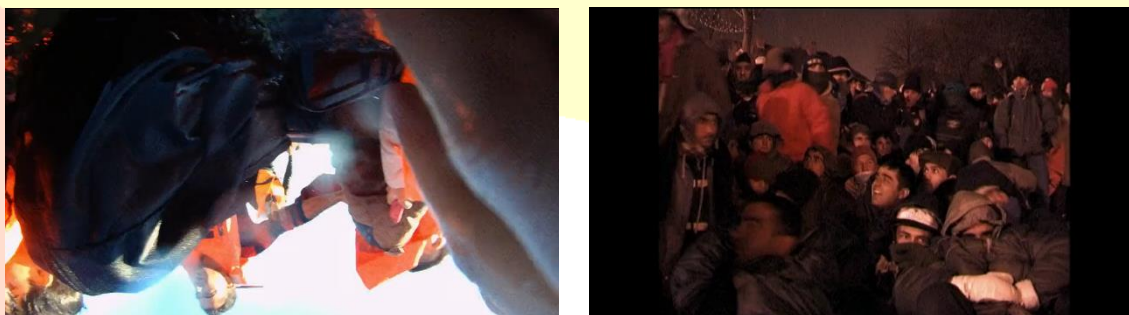
Imagens 5 e 6 – Frames de comparação de Rostos em Purple Sea (2020) e Border (2004)