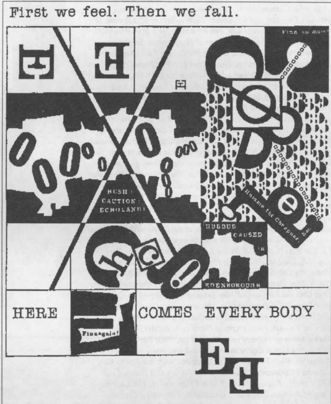
Jacob Drachler, in Id-Grids and Ego-Graphs — A Confabulation With Finnegans Wake. Brooklyn: Gridgraffitti Press, 1978.