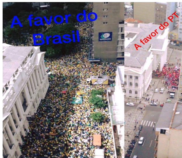
Figura 2: Apropriação dos símbolos nacionais. Curtidas: 2.430. Compartilhamentos: 5.177.

serviço de grupos específicos, em detrimento dos interesses públicos da parcela mais expressiva da população. Procura evidenciar uma única leitura dicotômica da realidade política, aquela que interessa ao pensamento hegemônico. Outras visões não têm espaço nesse enquadramento. A realidade composta de um mosaico de forças é reduzida a dois movimentos para simplificar e tornar a complexidade imperceptível. As visões que se confrontam com a perspectiva dominante e majoritária são desencorajadas, constrangidas.