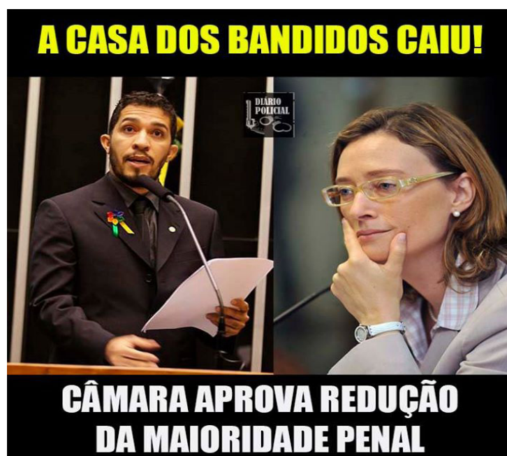
Figura 3: Criminalidade. Curtidas: 619. Compartilhamentos: 2.424.

Os deputados federais Jean Wyllys e Maria do Rosário, que atuam em favor dos direitos humanos e também contra a redução da maioria penal, são apresentados como bandidos. A democracia traz o alargamento não só de políticas, mas também da defesa do cidadão, preservando garantias individuais. Ao se colocar ao lado dessas conquistas, os deputados são denunciados como bandidos, apresentados como agentes desestabilizadores da segurança. A atuação de ambos na Câmara Federal, a casa legislativa, é proposta como lugar onde se abrigam posições e práticas criminosas, pouco interessadas no combate ao crime. A atuação dos parlamentares é apontada como extensão da rede delinvente. Afirma-se o viés autoritário, imbuído de uma visão simplificadora da estrutura social com foco na repressão das classes populares para garantir a segurança pública para as classes dominantes.