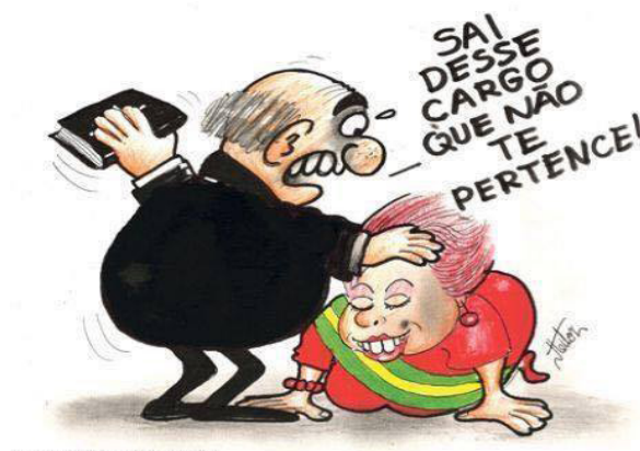
Figura 1: Crítica à mulher. Curtidas: 1.183. Compartilhamentos: 6.659.